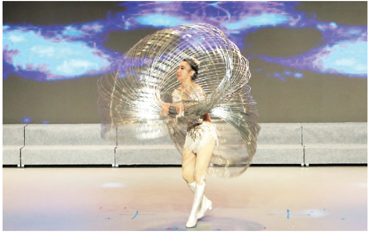
北京职工艺术团助演节目杂技《晃圈》