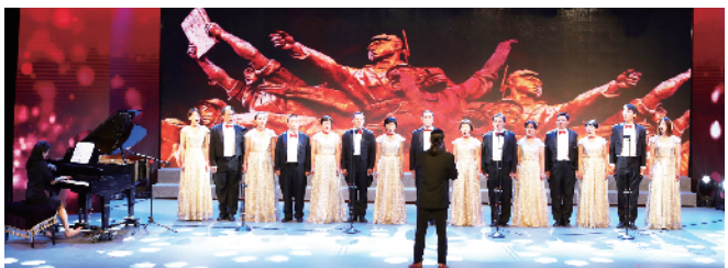
区农业农村局工会参赛小合唱《国际歌》获得三等奖