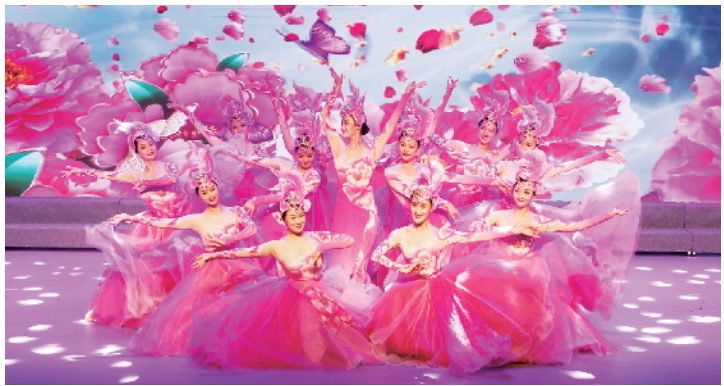
北京职工艺术团助演节目舞蹈《盛世牡丹》