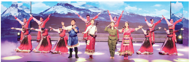
北京汽车博物馆工会、中关村科技园丰台园工会、戎威远保安服务(北京)有限公司工会参赛表演唱《北京有个金太阳》获得二等奖