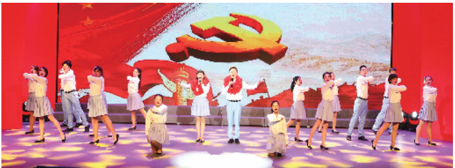
区医疗保障局工会参赛表演唱《医保歌声献给党》获得三等奖