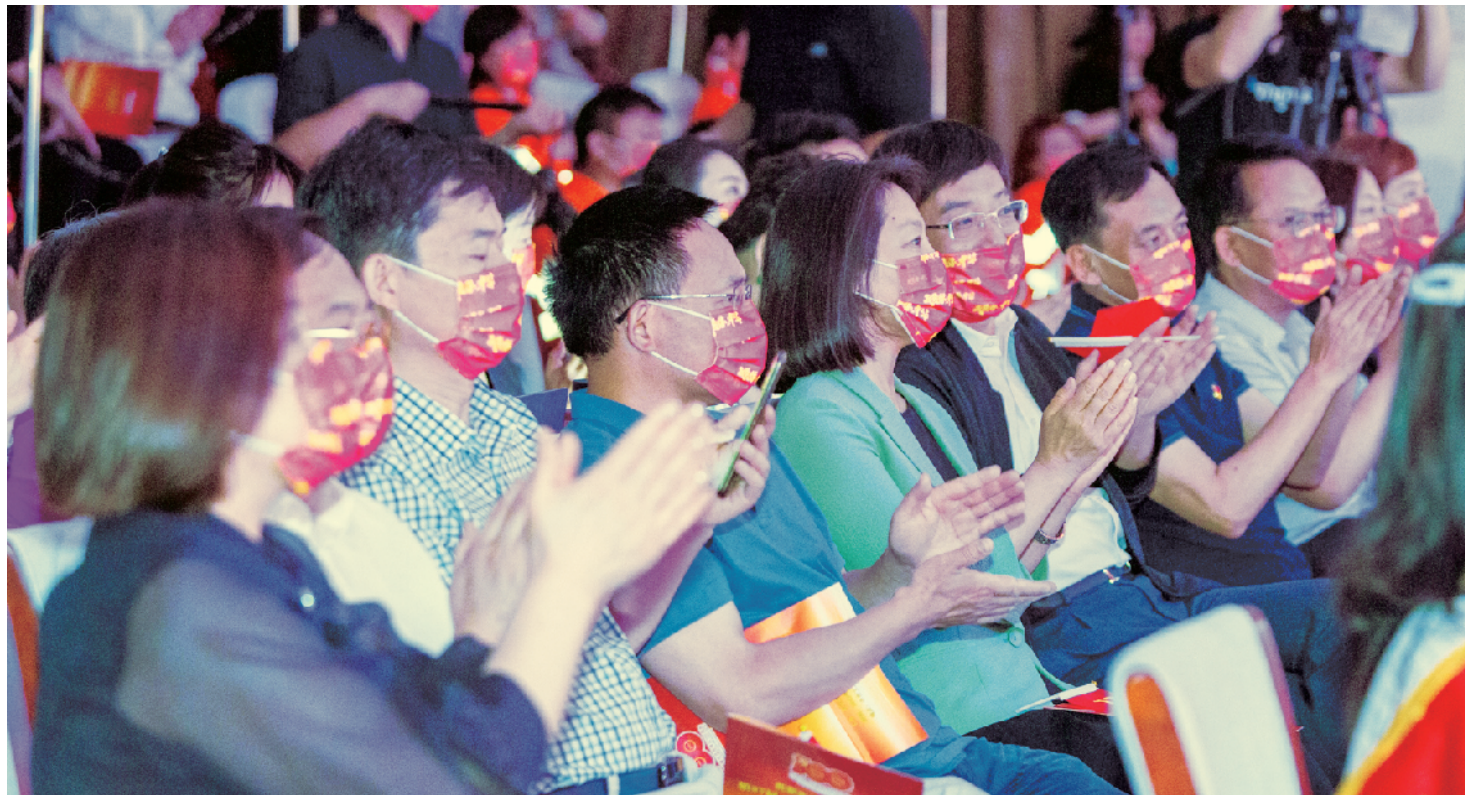
现场领导和观众为演员们的精彩表演鼓掌喝彩