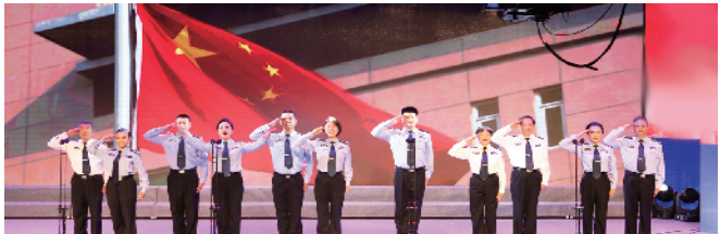
北京市公安局丰台分局工会参赛小合唱《祖国不会忘记》获得二等奖