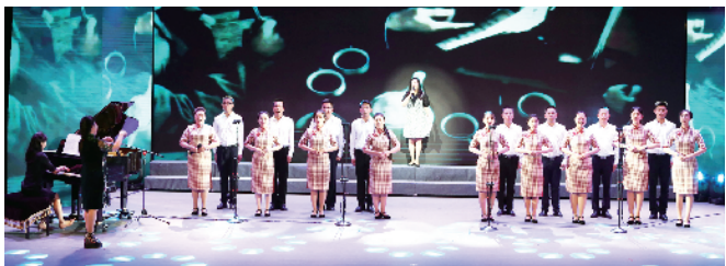
区纪委监委工会参赛小合唱《南湖的船,党的摇篮》获得三等奖