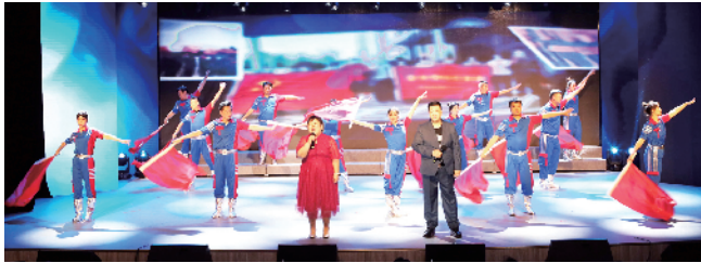
区房管中心工会参赛情景剧《使命在劳动中践行》获得最佳表演奖