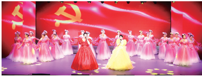
丰台街道总工会、区人社局工会、和义街道总工会参赛歌舞《春天中国》获得一等奖