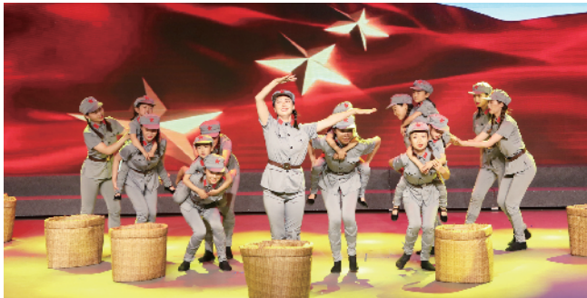
方庄地区总工会参赛舞蹈《马背摇篮》获得一等奖