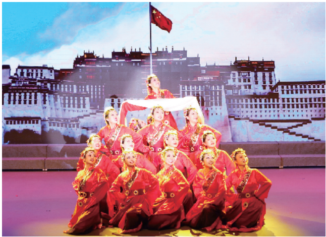
区税务局工会参赛舞蹈《心声》获得一等奖