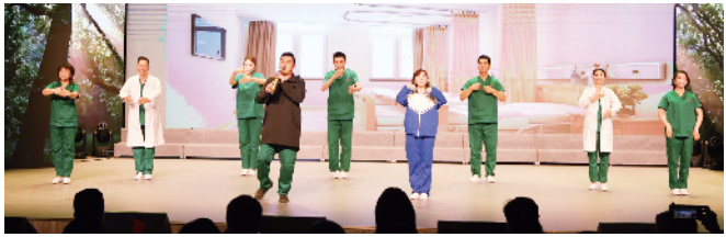
区卫生健康系统工会参赛情景诗《医者初心》获得三等奖