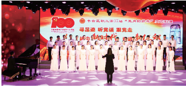
区教育工会参赛合唱《追寻》获得特等奖