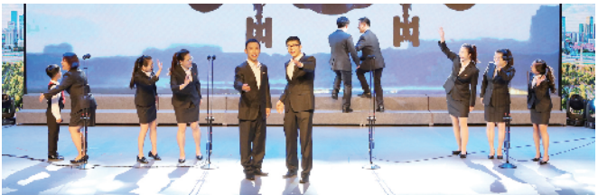
丽泽管委会工会、丽泽控股公司工会、北宫镇总工会参赛小合唱《红旗下的丽泽之光》获得三等奖