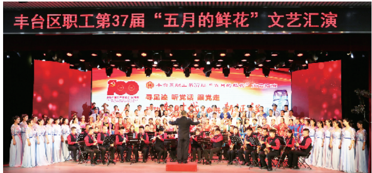
百人大合唱《没有共产党就没有新中国》