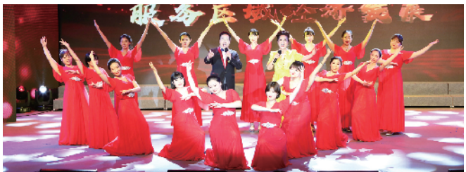
区国资中心工会、集美控股集团有限公司工会参赛男女对唱《把一切献给党》获得二等奖