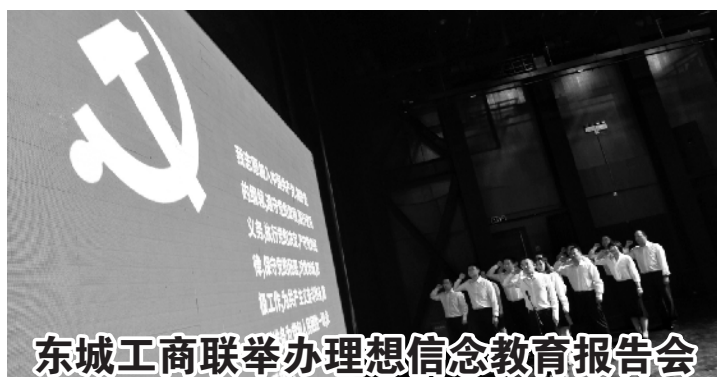
东城工商联举办理想信念教育报告会

已参加本市机关事业单位基本养老保险的用人单位,需通过北京市人力资源和社会保障局官方网站申报2021年度“五险一金”及机关事业单位基本养老保险和职业年金缴费工资,无需提供纸质材料。另外,也可通过“机关事业单位养老保险单机版”申报,申报时需打印《北京市2021年机关事业单位社会保险缴费工资申报汇总表》一式两份,加盖主管部门印章后,用人单位和社保经办机构各留存一份。