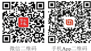
微信二维码 手机App二维码

□2021年6月5日星期六 □第359期 总第7685期 □辛丑年四月廿五 国内统一刊号：CN11—0221 邮发代号：1—376 网址：www.workerbj.cn