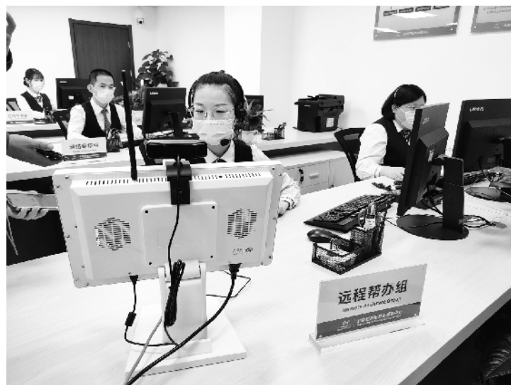
经开区政务服务中心提供远程帮办服务