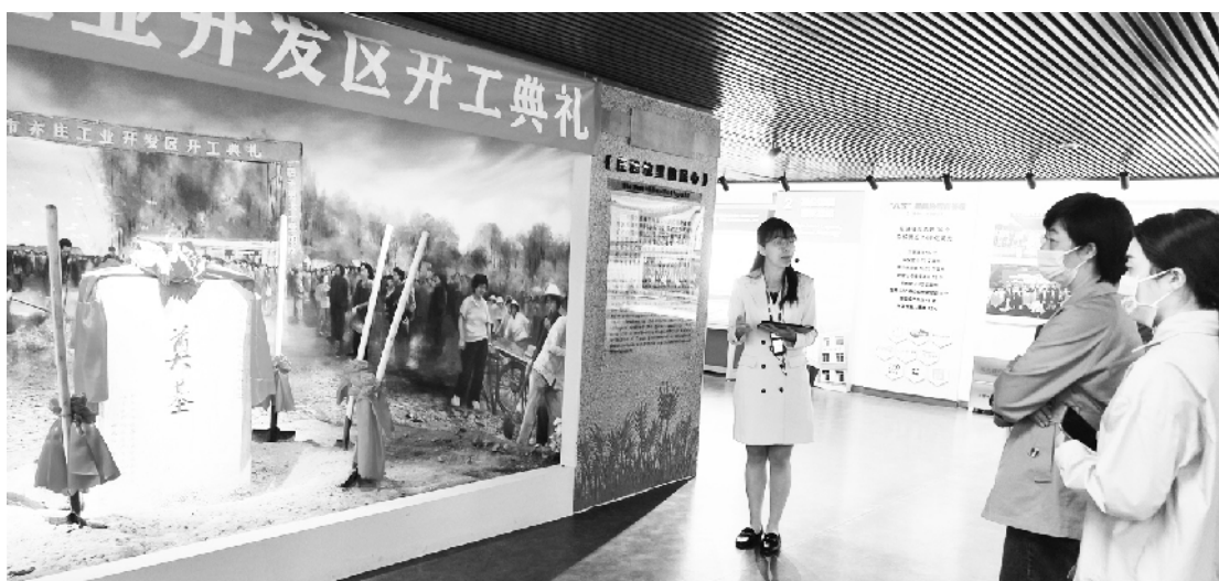
经开区区史馆讲解员讲述“红楼精神”