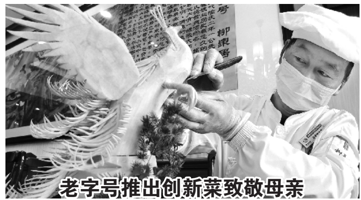
老字号推出创新菜致敬母亲

市教委同时对涉及中小学校和教师的督查检查评比考核事项进行一次集中清理,形成《区级层面设立的督查检查评比考核事项清理清单》,要求各区推进落实。