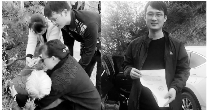
此外，须注意的是，各景区也应建立起完备的救援救助救治机制，从而让游客安全愉快游玩。梳理媒体报道就会发现，景区内游客突发疾病现象时有发生，如何做好应对，需要景区做好设施及人员应急储备，以备不时之需。

热海景区内不慎落水，受到其他游客及景区管理人员的救助。为此，景区决定：将为见义勇为的2名游客提供终生免费游览火山和热海景区的服务。褒奖见义勇为者就需要来点“实在”的。这也需要从法律、政府、企业和社会等各个层面共同发力，用见得到的实惠举措让见义勇为者得到褒奖。也唯有如此，才能够让“英雄流血又流泪”事件少出现、不出现，才能够充分发挥出褒奖善举的激励效应，鼓励更多人站出来、匡扶正