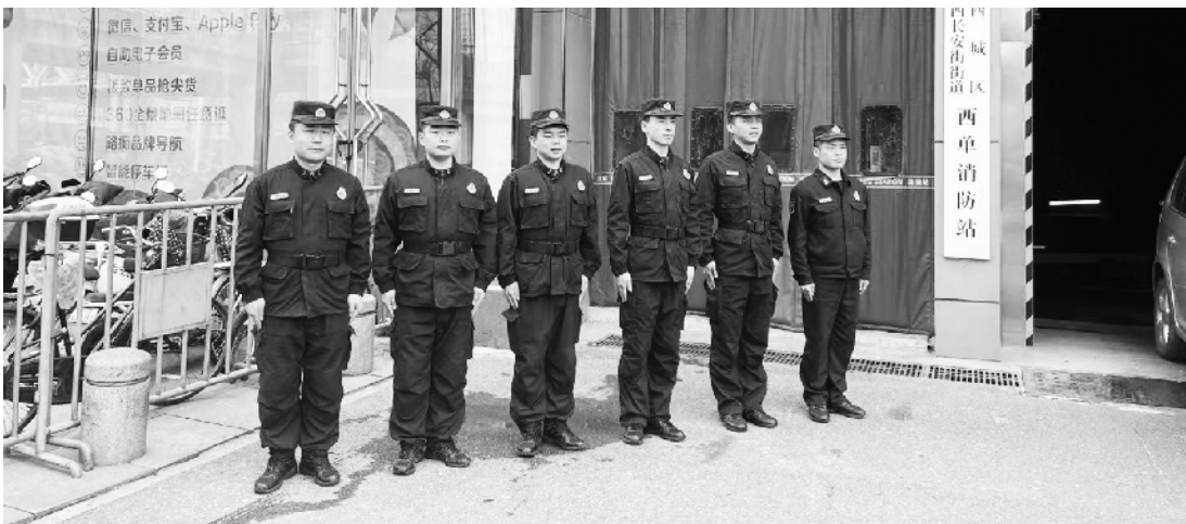
一大队部分队员在西单小型消防站门口合影

“有了完备的消防设备,一旦发生火灾,自动探测系统就会报警,同时联动启动相关消防设施,