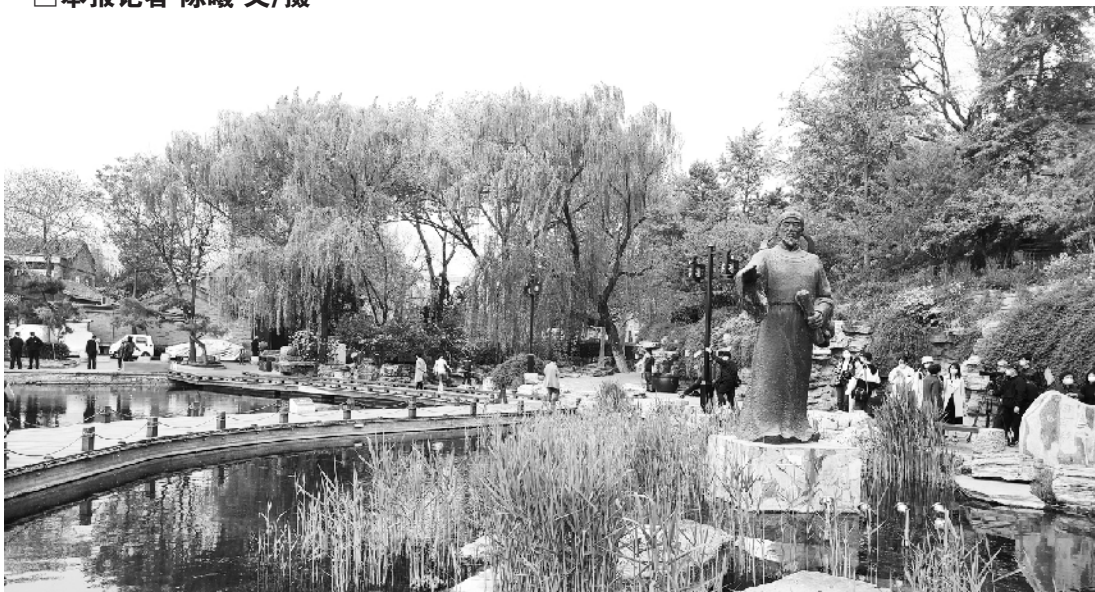
西海湿地整体环境提升，成了周边居民遛弯、锻炼的好去处

近年来，西城区以首都发展为统领，以推动高质量发展为主题，以改革创新为根本动力，以满足人民群众日益增长的美好生活需要为根本目的，做好“六稳”“六保”工作，紧抓“两区”“三平台”战略机遇，全力推动核心区控规落地落细，助力首都经济高质量发展，让老城愈加庄重大气，让居民拥有更多获得感、幸福感、安全感。