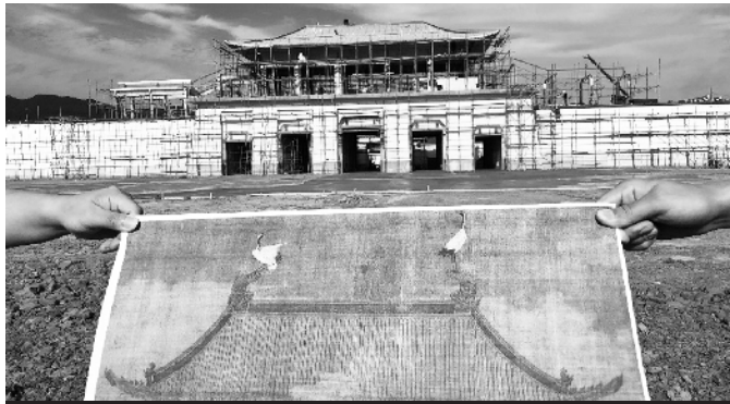
复刻北宋皇宫实景

这是河南省巩义市河洛镇双槐树遗址出土的骨针。4月13日，2020年度全国十大考古新发现在北京揭晓。这十大新发现为：贵州贵安新区招果洞遗址；浙江宁波余姚井头山遗址；河南巩义双槐树遗址；河南淮阳时庄遗址；河南伊川徐阳墓地；西藏札达桑达隆果墓地；江苏徐州土山二号墓；陕西西安少陵原十六国大墓；青海都兰热水墓群2018血渭一号墓；吉林图们磨盘村山城遗址。