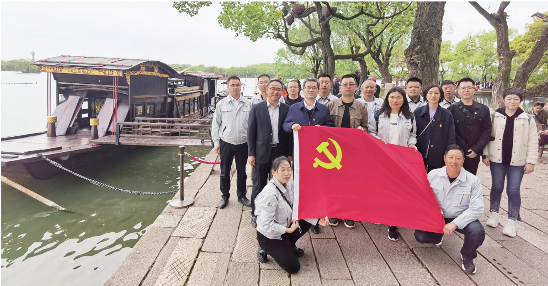
在红船旁开展党日活动