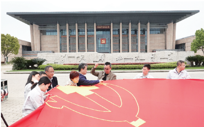
在南湖纪念馆前绣党旗

同日，北京建工路桥集团嘉兴嘉善项目“红色工地”正式挂牌，并在嘉善项目成立一支党员突击队、两支青年突击队，为项目建设打造战斗力。