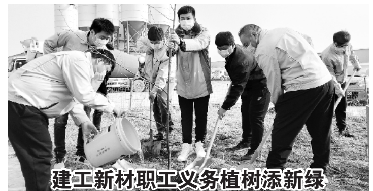
建工新材职工义务植树添新绿

工会相关负责人表示,此次讲座进一步增强了女员工的法律意识,解决了她们的维权疑难,让她们在家庭生活与婚姻生活中能够知法守法、依法维权,运用法律手段保护自己的权益。