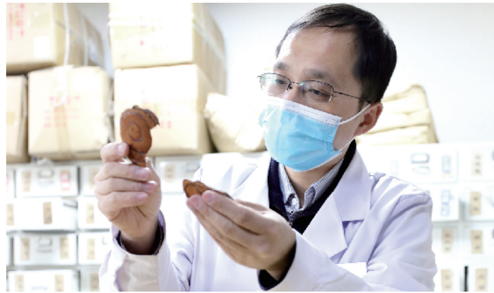
严检药品质量，确保药品疗效