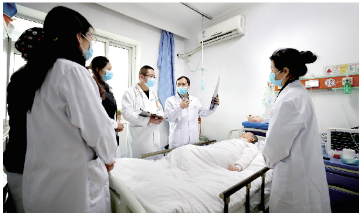
提出治疗意见，调整治疗方案