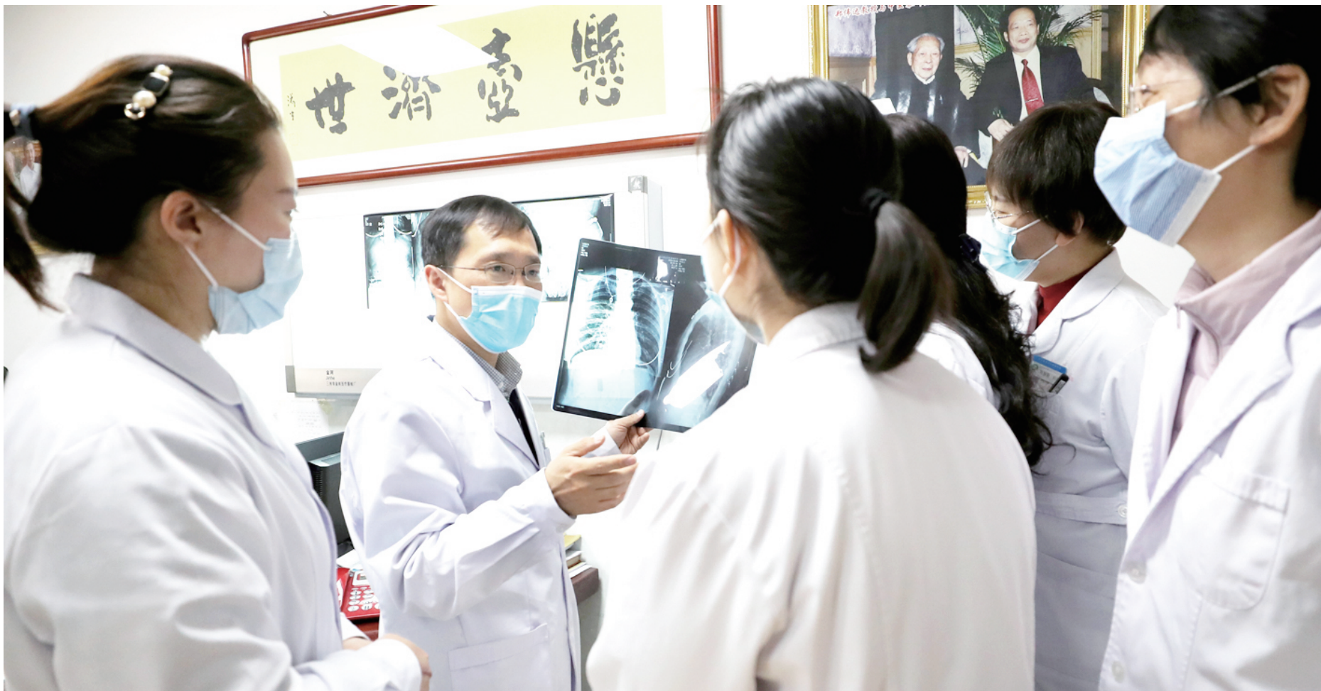
努力培养年轻医生迅速成长