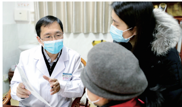
向患者讲明治疗的原理和方法，鼓励患者树立战胜疾病的信心