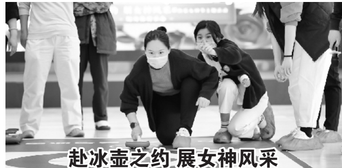
赴冰壶之约 展女神风采

在“三八”节来临之际,怀柔安佳医院工会组织开展了以“赴冰壶之约,展女神风采”为主题的陆地冰壶活动。活动中,女职工充分学习了了解了冬奥知识、冰壶历史以及冰壶规则,感受了冰雪运动带来的“速度与激情”。