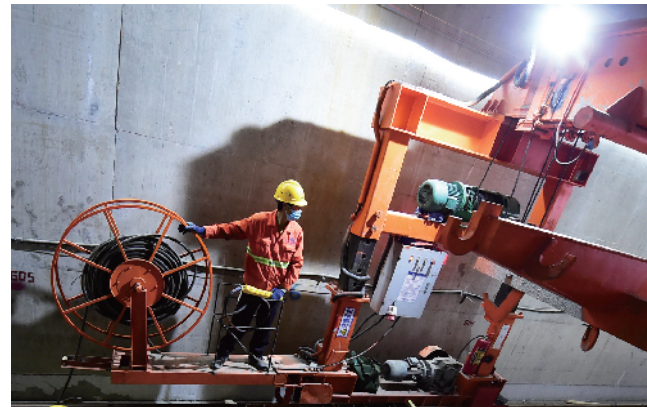
吊运工在隧道内精心操作吊装设备