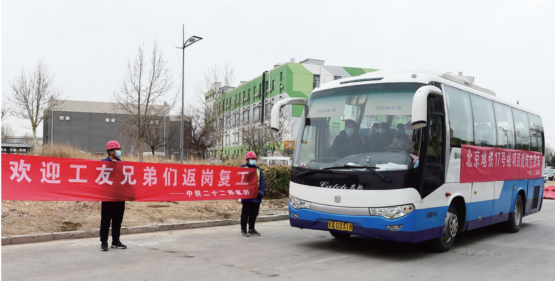
欢迎返岗工人安全归队