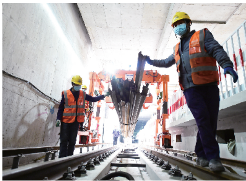
工人在隧道铺设钢轨