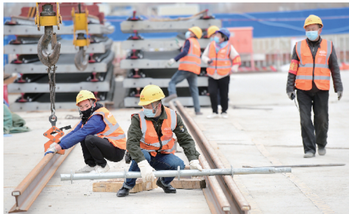
工人对钢轨测量、剪裁