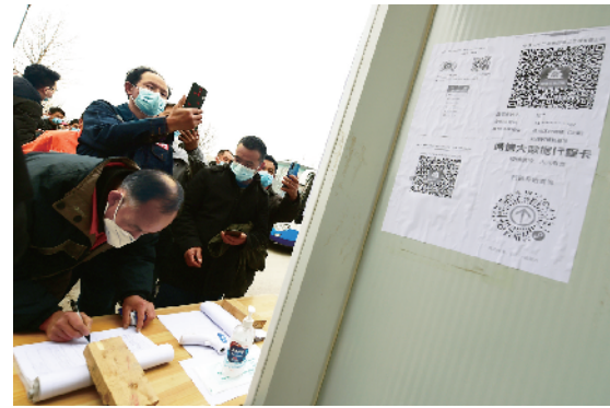
返京工人进工区，必须要扫码登记