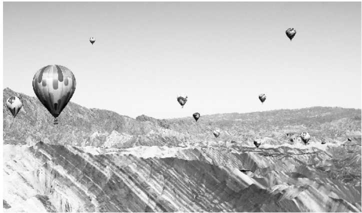
全飞行器”，就当以事故为鉴，补齐经营短板和监管空白，用制度完善规范企业和行业发展，严把准入关、培训标准化，让浪漫与安全齐飞并行。

亡事故，就暴露出浪漫与刺激背后的安全风险。确保其经营规范和有序发展，就当系好“安全绳”、拧紧安全阀，健全安全机制和措施。 载客热气球对行业入门和运营规范有极高要求，包括气象、风速、设备、燃料及操作等在内的任何一个细节，都有可能成为导致人身伤亡的安全隐患。从当下情况看，一些热气球项目未考虑地貌、气象条件等适配度就盲目上马；工作人员培训也纯属图形式、走过场，形同儿戏。 生命诚可贵，安全重如山。确保热气球成为名副其实的“安