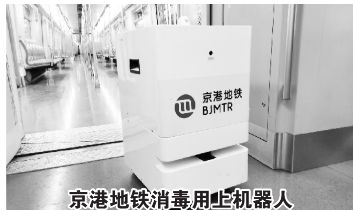
京港地铁消毒用止机器人

各庄村、北石槽镇西赵各庄村、北石槽镇北石槽村、赵全营镇联庄村，大兴区天宫院街道融汇社区。其他地区均为低风险地区。此外，顺义区南法信镇西杜兰村近14天内无新增确诊病例或聚集性疫情，经市疾控中心评估，按照《北京市新冠肺炎疫情风险分级标准》，自2021年1月18日起，该地区调整为低风险地区。