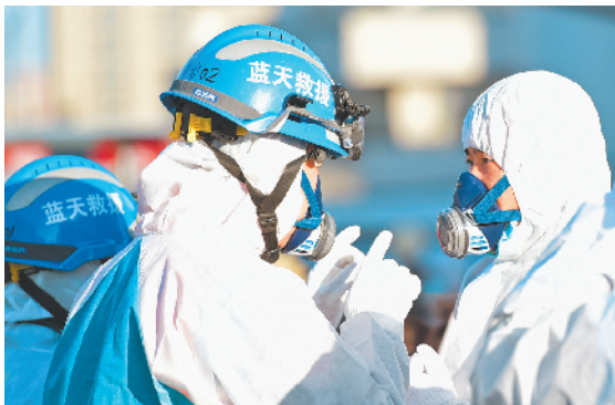
老队员向新队员传授实战经验。