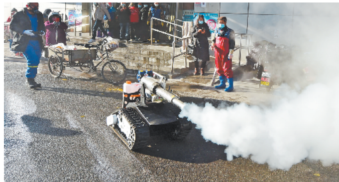
开路先锋，“坦克”冲锋。