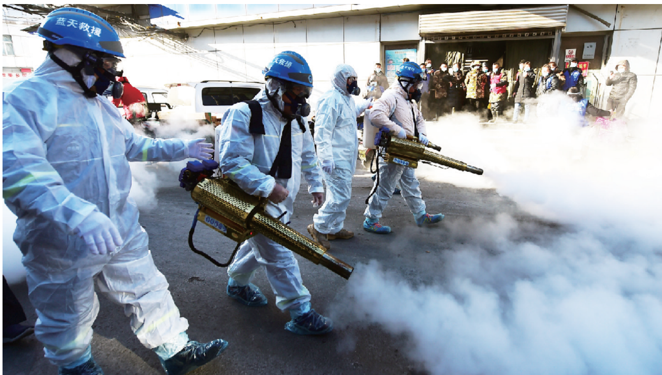
历经3个多小时，市场内停车场、冷链等区域全部完成消杀作业。