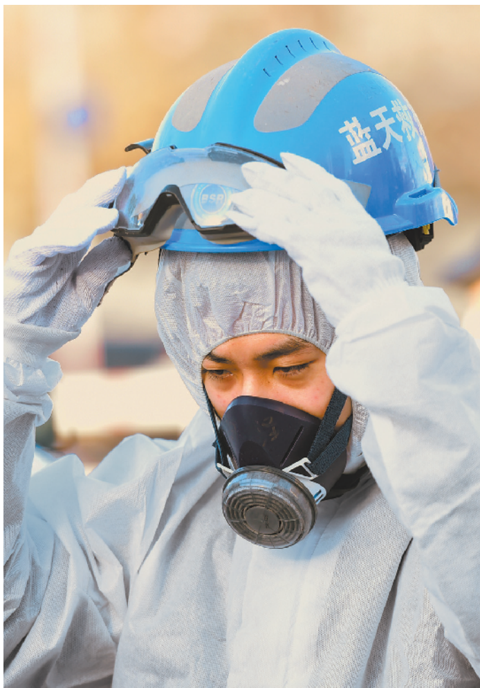
第一次参加实战，新队员有点儿紧张。