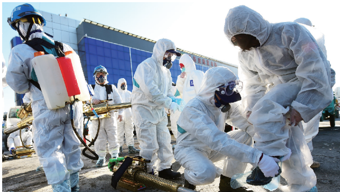
队员相互检查安全防护着装。