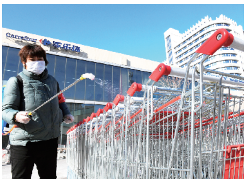
家乐福严把疫情防控关,对敏感区域采取2小时一消毒,结账1米线,确保市民购物安全。