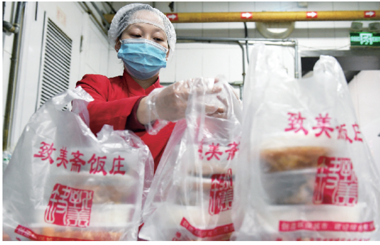
老字号致美斋饭庄提倡食客打包回家品美食,打造新年就餐新方式。