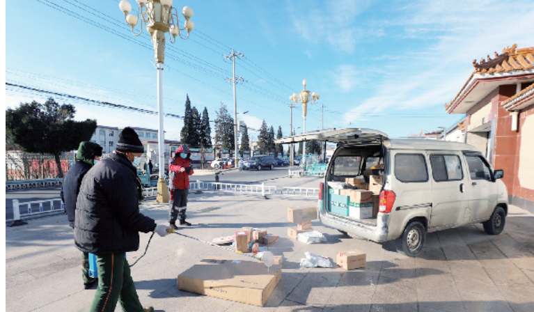
牛栏山镇北孙各庄,村委会工作人员对快递车以及包裹进行消毒。

懈地守护着这座城市的安全。寒风中,还有指挥道路的交通警察、清洁城市的环卫工人、维护秩序的公交“黄马甲”;有医护人员、工会干部、巡逻队员,以及在不同岗位上恪尽职守、默默奉献的劳动者。 正是这无数的普通人,无数的劳动者,用坚强的毅力、超常的忍耐力、强烈的责任感,用坚守、付出,让我们的生活变得更安全、更温暖、更幸福;也用坚守,让城市变得更有温度、更有力量、更有希望。 “人间烟火味,最抚凡人心”。在辞旧迎新的日子,让我们向这些寒冬中坚守岗位和普通劳动者道一声:谢谢! 新年好,劳动者! 加油,所有人!