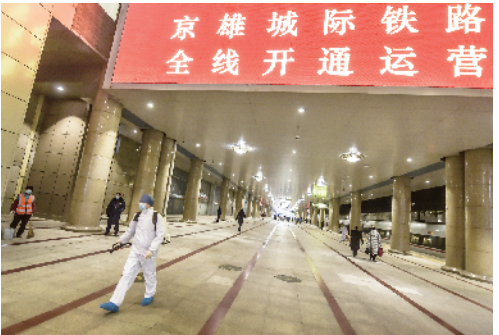
北京西站各场所定时消毒,保障旅客安全出行。