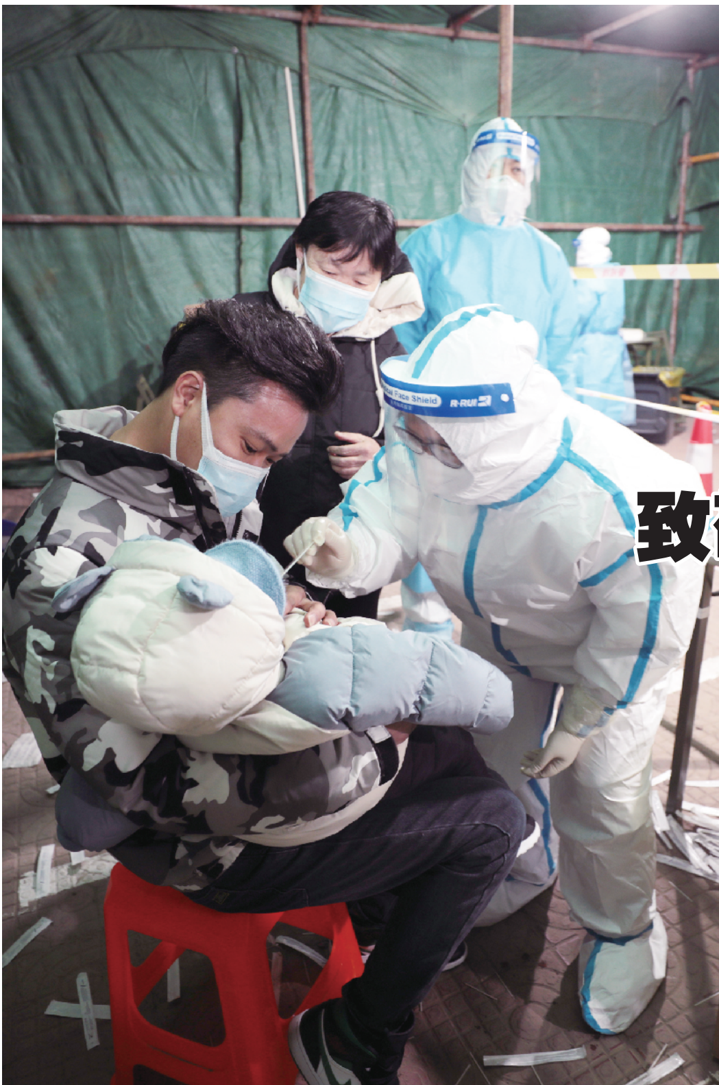
为了让百姓安全踏实过节,牛栏山镇政府对辖区33个片区开展“拉网式”核酸检测工作,在紧张的采集工作中,专门为老人和小孩开辟绿色通道,完成扫码预约。