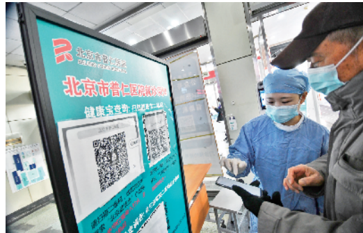
医护人员帮助老年人使用手机查验健康码。