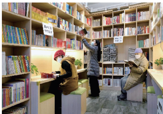
交道口街道总工会职工书屋内,工作人员热情提醒大家要戴好口罩保持安全距离。