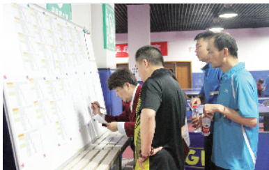
裁判统计比赛成绩