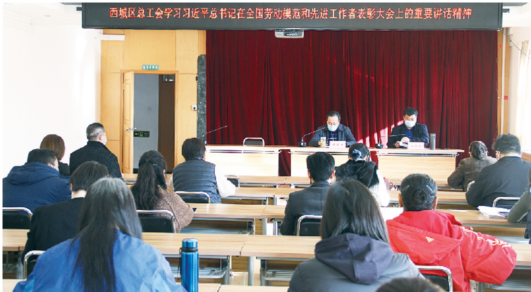
区总工会干部学习习近平总书记在全国劳动模范和先进工作者表彰大会上的重要讲话精神