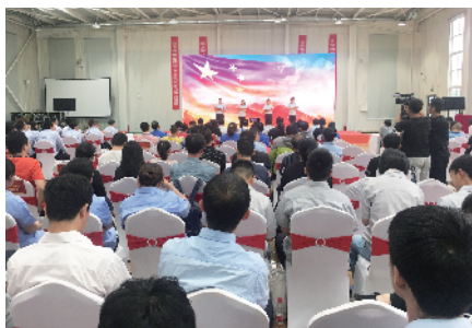
指导金都置业有限公司组织开展“不忘初心担使命 同心共筑新丽泽”主题演讲比赛