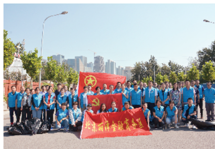
组织开展“市容环境大扫除,干干净净迎国庆”主题党日活