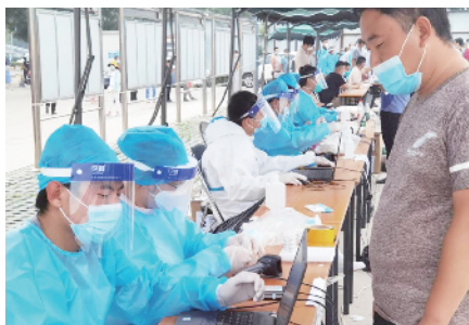
为商务区项目工人做核酸检测