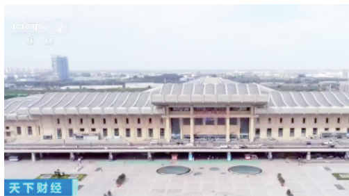
京沪高铁票价将建立灵活定价机制