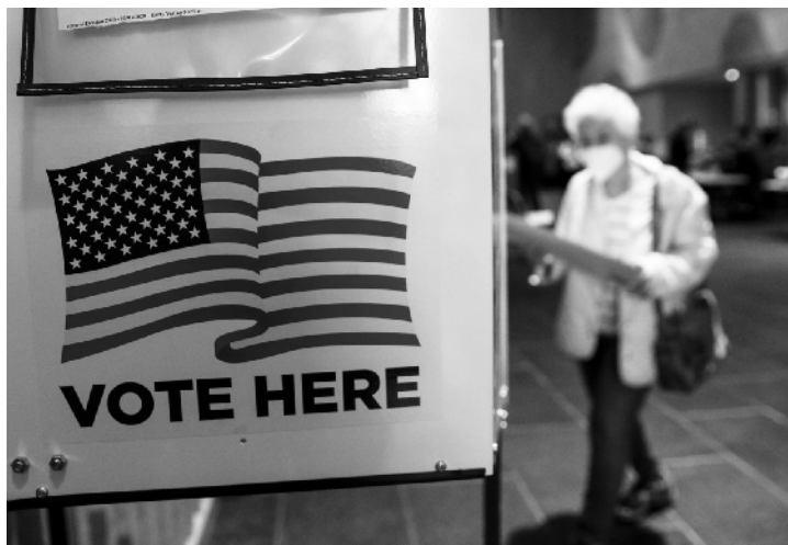
10月24日，选民在美国纽约林肯中心投票点提前投票。

高额选举费用实质上是利益集团“合法合规”笼络候选人的结果。美国最高法院2010年允许企业与工会“无上限”地向支持候选人的“超级政治行动委员会”捐款，2014年又取消了对个人政治捐款总额的限制，这意味着曾经压在资本头上的“紧箍咒”不复存在。挣脱束缚的金钱加速与政治权力结合，直接导致近年来美国从总统选举到国会与