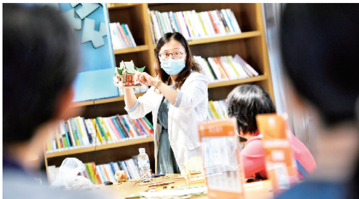
市民在老师的带领下赏析中国古典建筑之美。