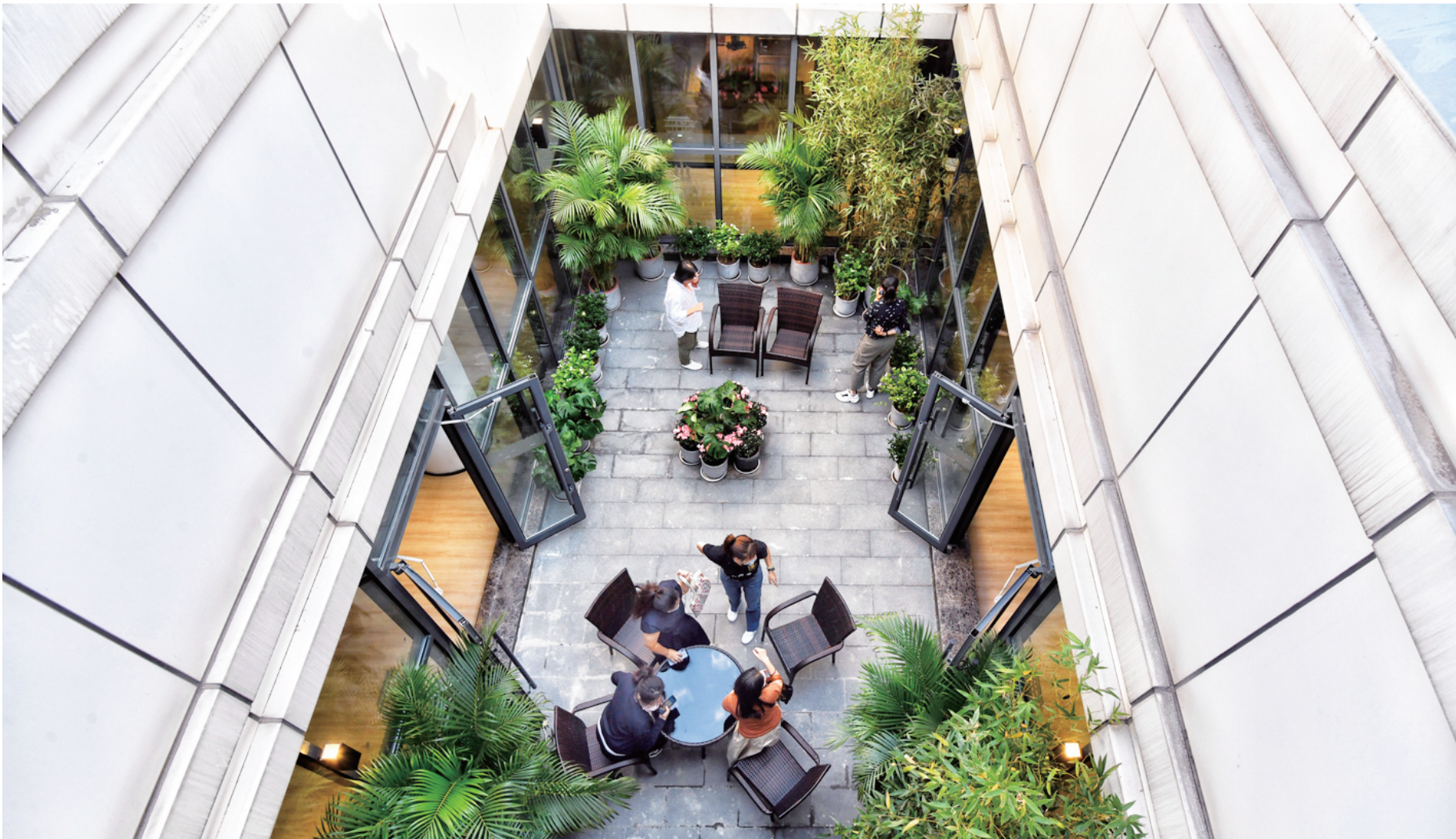
位于美术馆后街的“美后肆时”市民文化中心，由一座四合院改建而成，其下沉式天井花园环境怡人。