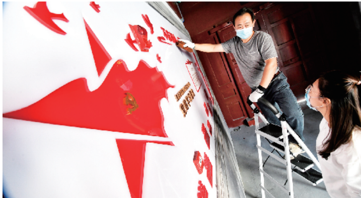
工作人员安装党建学习园地的贴图。

据介绍，景山街道市民文化中心取名“美后肆时”，寓意“四季更新，四时更迭，美好永不间断”，是美术馆后街地铁8号线盾构工程腾退后新建落成的地标级公共文化场馆。其两进式的四合院，地上一层，地下三层，共有活动空间21处，可为市民提供阅读、歌舞、戏剧、国学、艺术、文创等主题的公共文化服务和特色文化体验。“美后肆时”景山街道市民文化中心正式启动后，每天上午9时至晚上9时、全年365天对公众开放。常态化文化活动市民可关注“美后肆时”微信公众号，了解活动动态，进行预约报名。