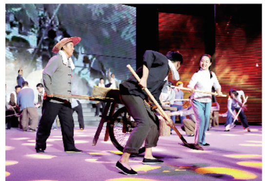
精彩的文艺节目，再现当年水库建设的动人场景。