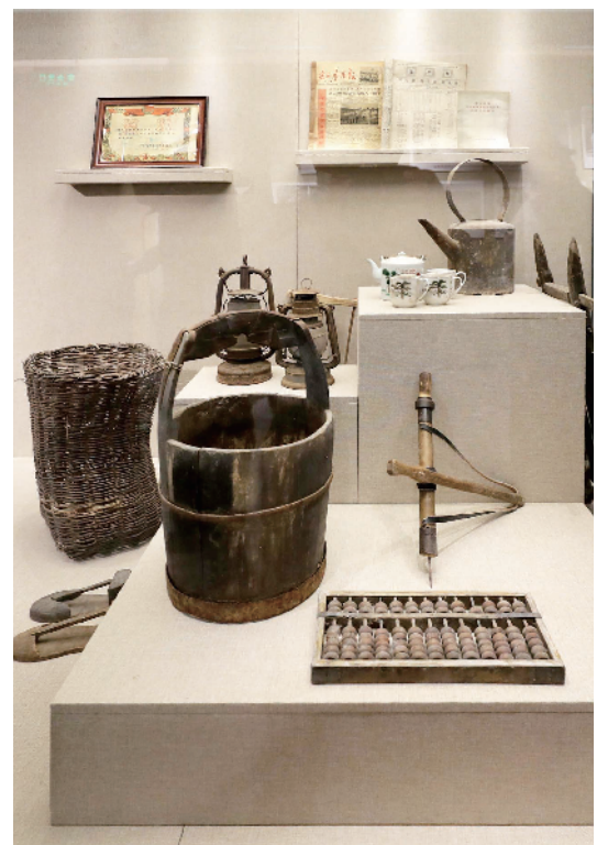
展览馆内的展品，讲述着密云水库的故事。