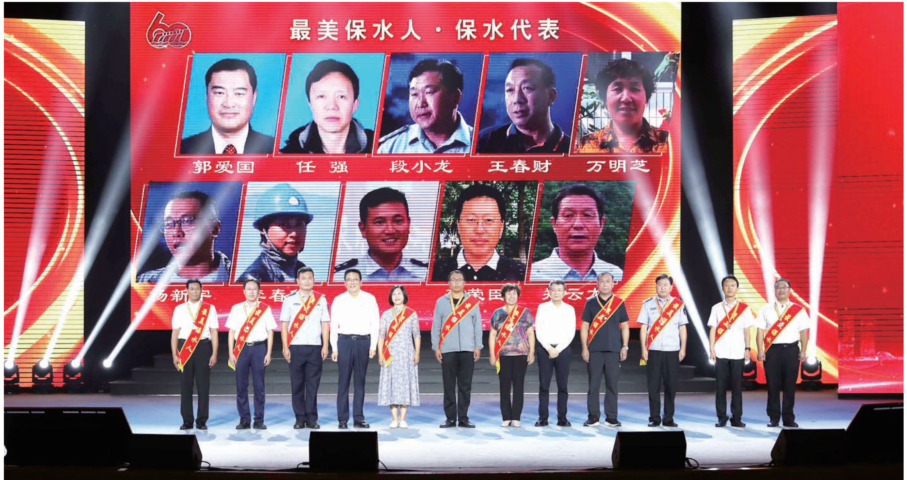
30余位“最美保水人”受到表彰。