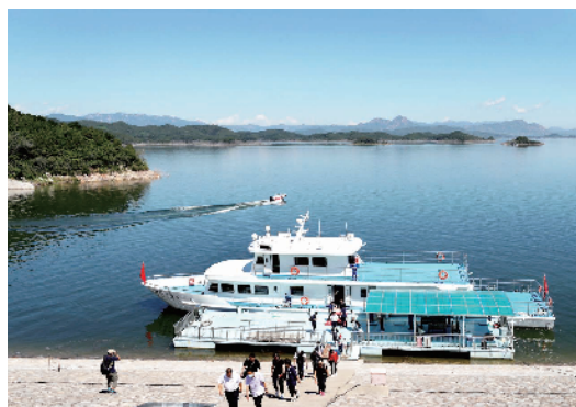
密云水库当前使用的是环保型电力推动船。