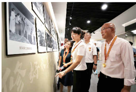
劳动模范代表赴密云水库展览馆参观。