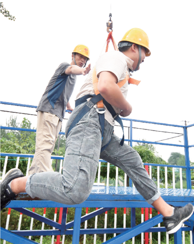
新职工在安全教育基地体验安全绳。

从书香满溢的象牙塔，走入土方、钢筋、安全帽的施工现场，能不能快速适应？北京市政路桥总承包二部发挥人才培养机制优势，引导大学生走入社会，上好职业生涯第一课。