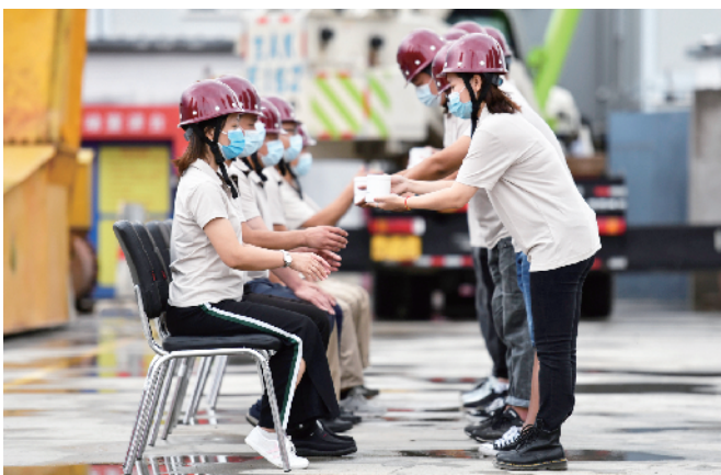
拜师仪式上，新职工向自己的师傅献茶。