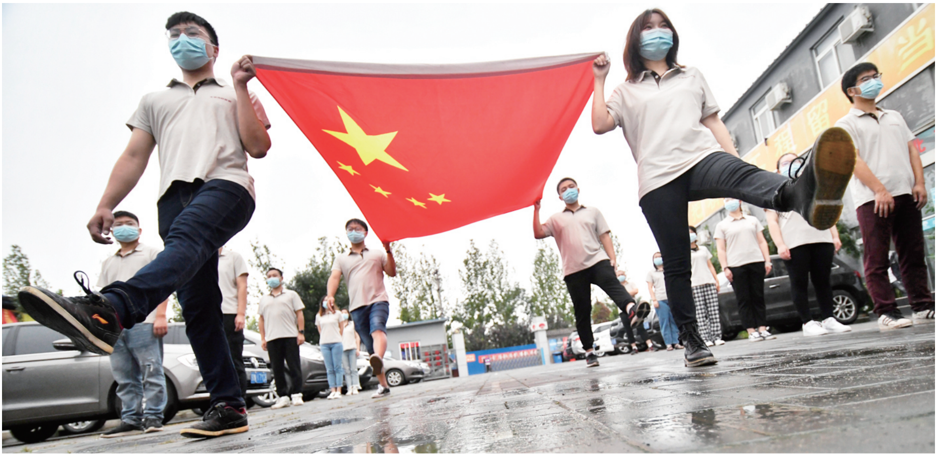
新职工作为擎旗手参加升国旗仪式。