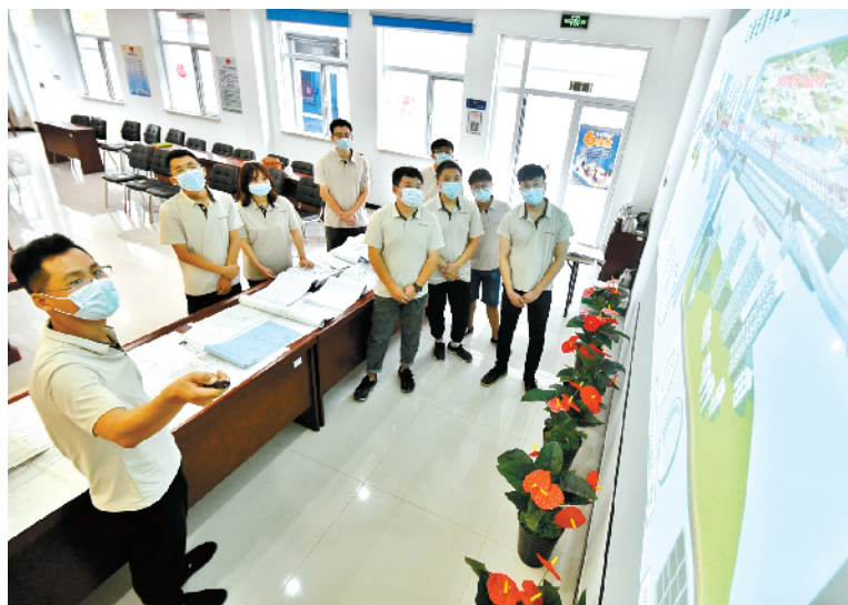
在地铁十七号线七标，工程师为新职工讲解建筑信息三维建模。