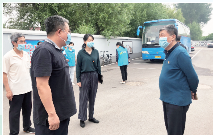
顺义区总工会到基层工会服务站调研,查看垃圾分类设施配置以及生活垃圾分类工作