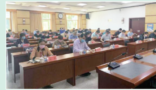
南法信镇总工会召开生活垃圾分类工作培训会