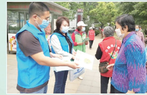
石园街道工会干部变身宣讲员,宣传垃圾分类知识