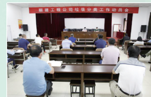
顺建工程公司召开垃圾分类工作动员会