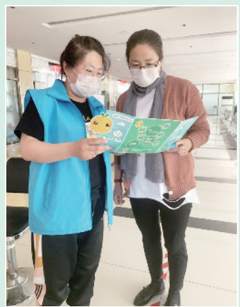
龙湾屯镇总工会开展垃圾分类专项活动