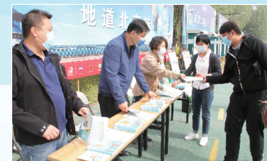
汉石桥湿地中心工会开展垃圾分类系列宣传活动