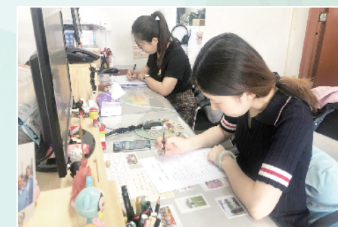
仁和镇机关工会开展垃圾分类知识问卷调查活动