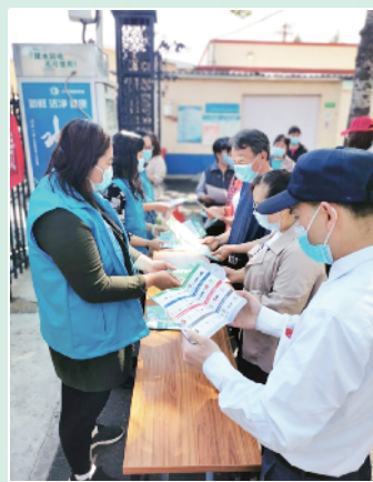
胜利街道总工会的专职社工参与垃圾分类宣传工作

中来,当好垃圾分类的践行者、监督者和示范者,争做垃圾分类新时尚的先行者和领跑者。切实提高了职工对垃圾分类知