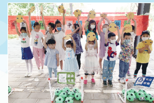
光明街道总工会举办垃圾分类主题活动