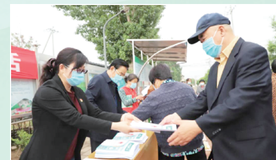
李遂镇总工会开展垃圾分类宣传活动