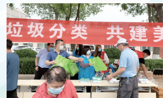
后沙峪镇总工会联合镇环境建设管理科开展垃圾分类宣传活动