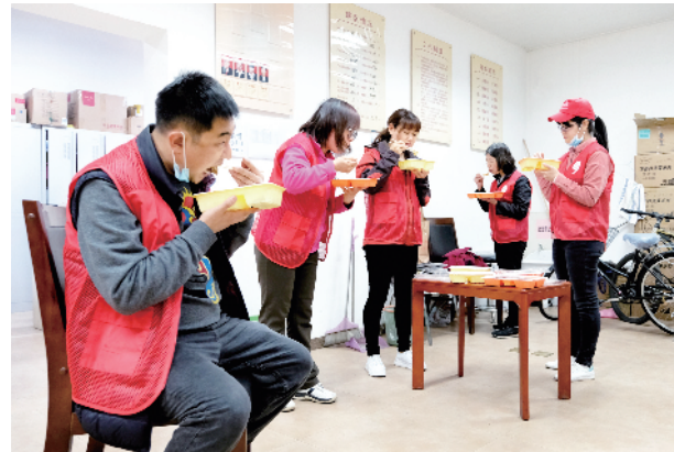
午饭时间，大家轮换用餐后，又迅速返回抗疫岗位。