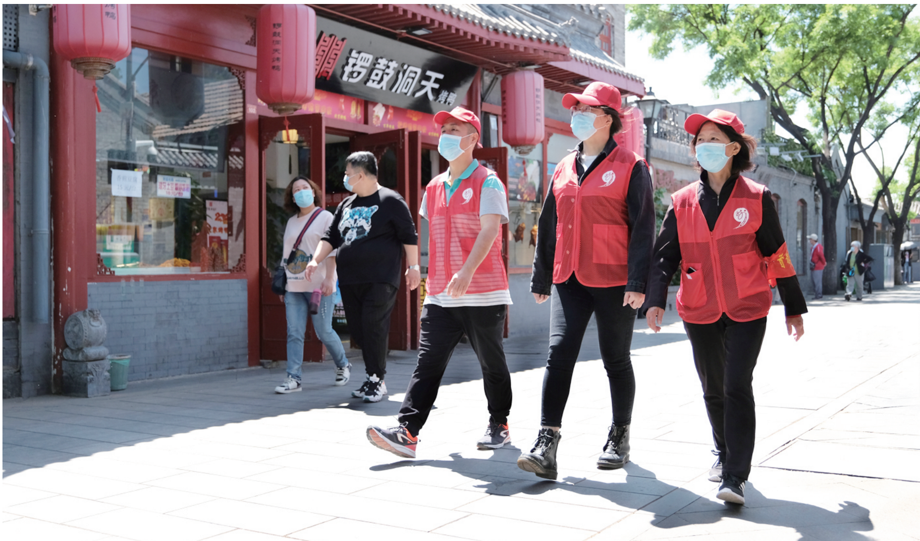
复工复产后，交道口街道工会服务站的抗疫服务小分队在街巷巡查。