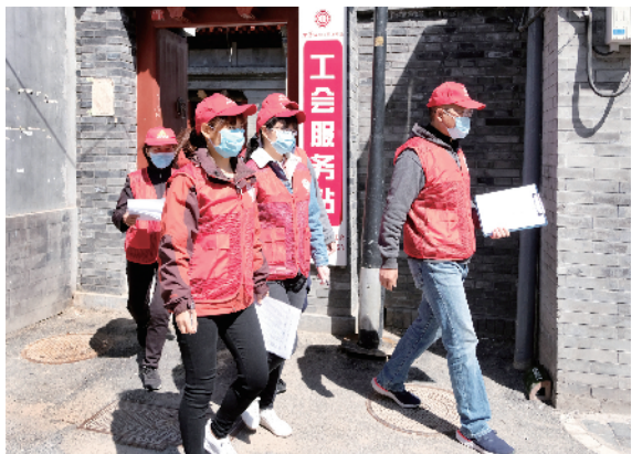
抗疫服务小分队从工会服务站出发，赶往各自的岗位。