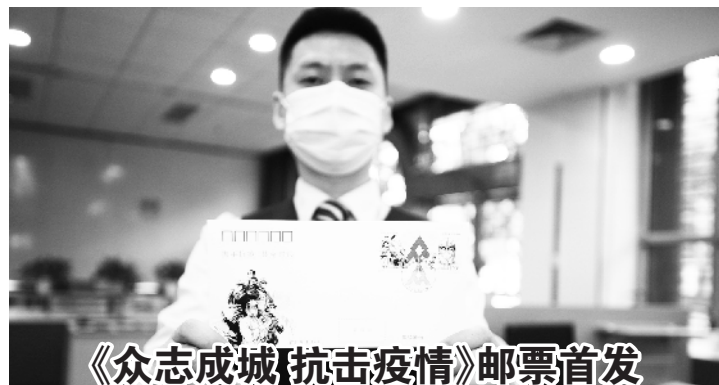
《众志成城 抗击疫情》邮票首发

11日,中国邮政集团有限公司特别发行《众志成城 抗击疫情》邮票1套2枚,全套邮票面值2.40元,计划发行1450万枚。该套邮票以“众”字将两枚邮票紧密连接,寓意着全国上下凝聚起众志成城、抗击疫情的强大力量。西城区分公司所辖服务区域内十二家邮政窗口线下对外销售。