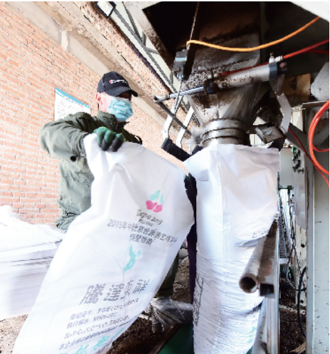
有机肥包装、入库、出库作业全部机械化操作。