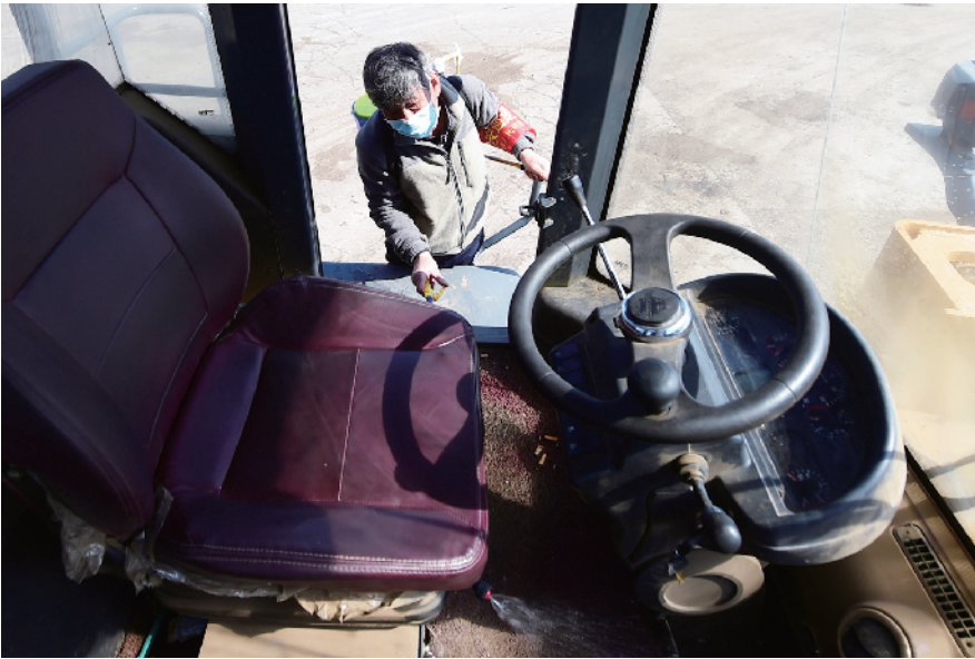
作业铲车、运输车定时消毒。