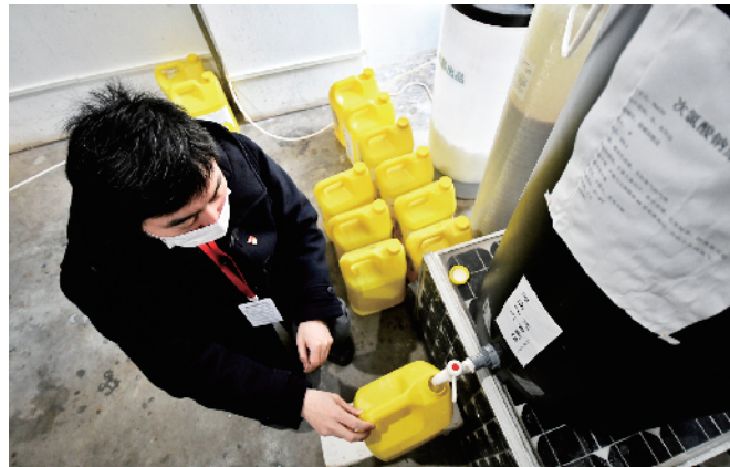
物业职工配制次氯酸钠消毒液。