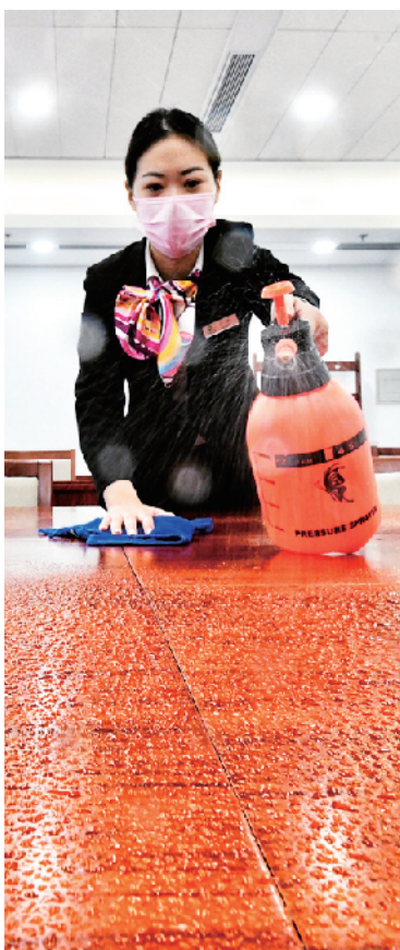
会前会后，会议室都要消毒。