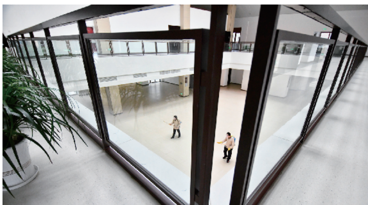
保洁人员对办公楼进行消毒。