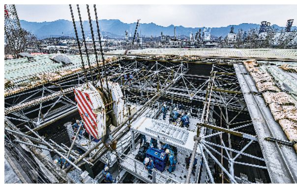
▶ 正在建设中的熔喷无纺布生产厂