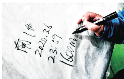
首批熔喷无纺布产出