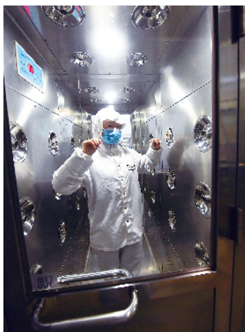
进入车间前,人人须消毒。