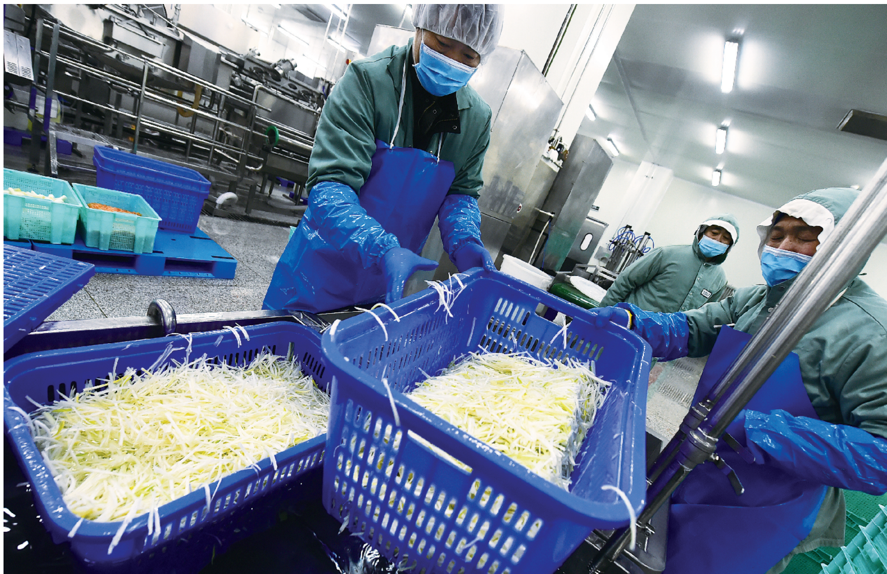
蔬菜消毒浸泡,必须三分钟。