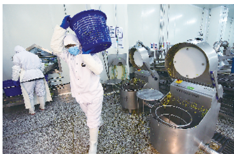
洗过澡的蔬菜,机器来甩干。