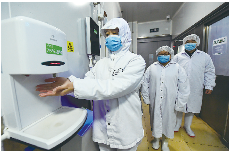
▲员工上岗,酒精“把关”。