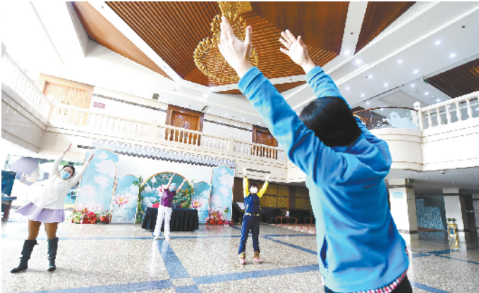
心理医生教“客人”跳音乐操。