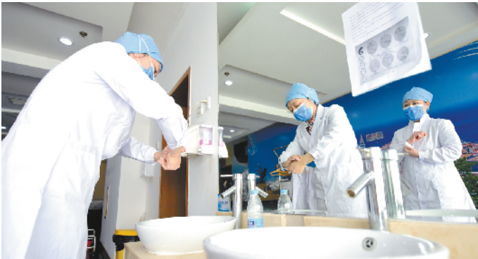
优秀心理医生、护士长、护理员，一个都不能少。