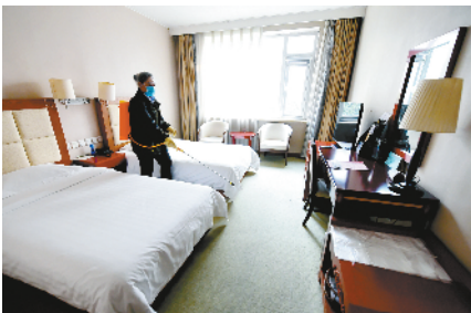
专业护理员每天定时消毒。