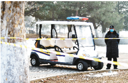
隔离警戒线，24小时安保。