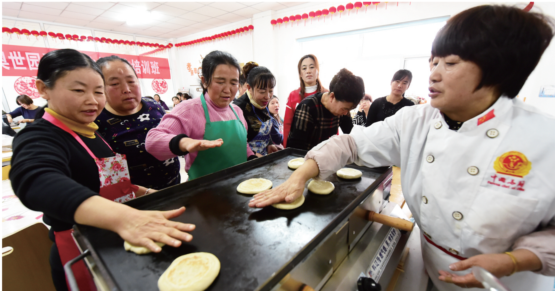
延庆区香营乡社保所聘请美食达人给乡亲们传授“火勺”烤技。