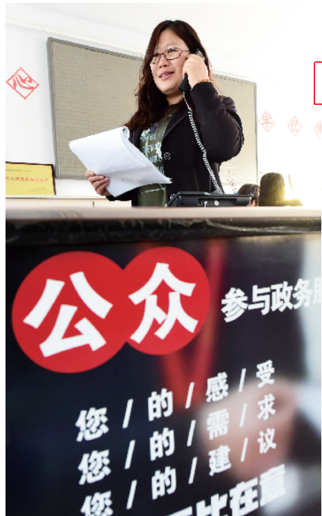
开展预约服务，村民办事便利多了。