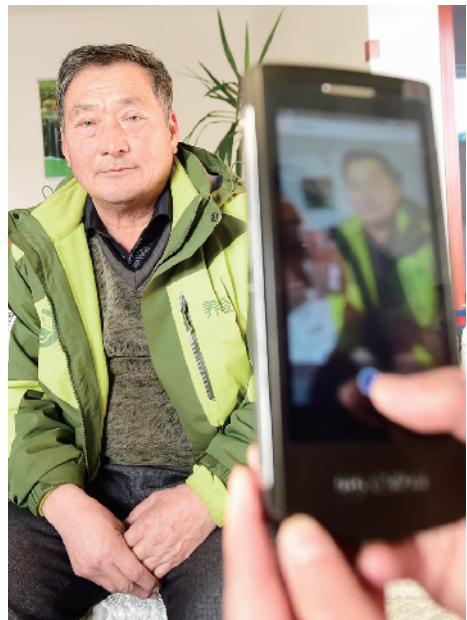
工作人员入户采集社保信息。