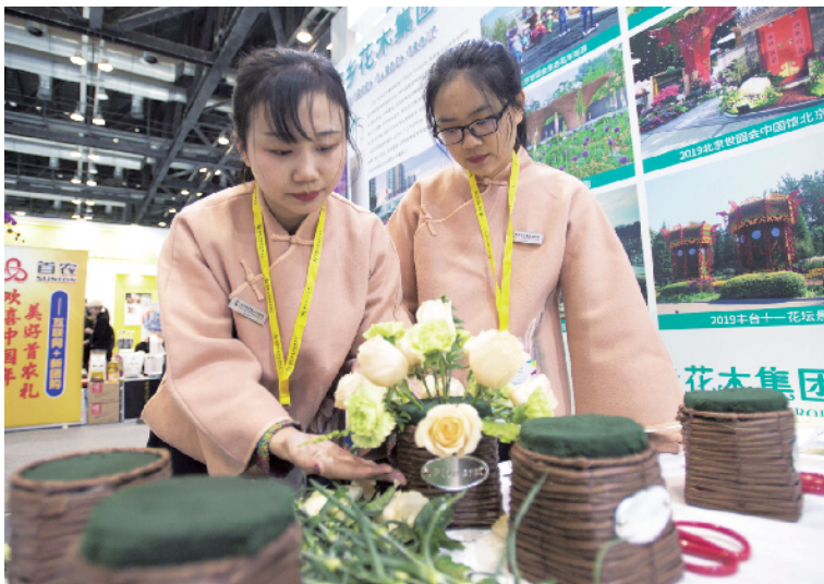
在丰台区总工会的展位上，花香花木集团工作人员表演插花。