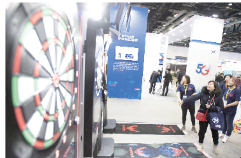
参观者在飞镖竞技展位一显身手。