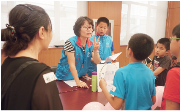
节假日期间，志愿者为救助对象开文化专场。