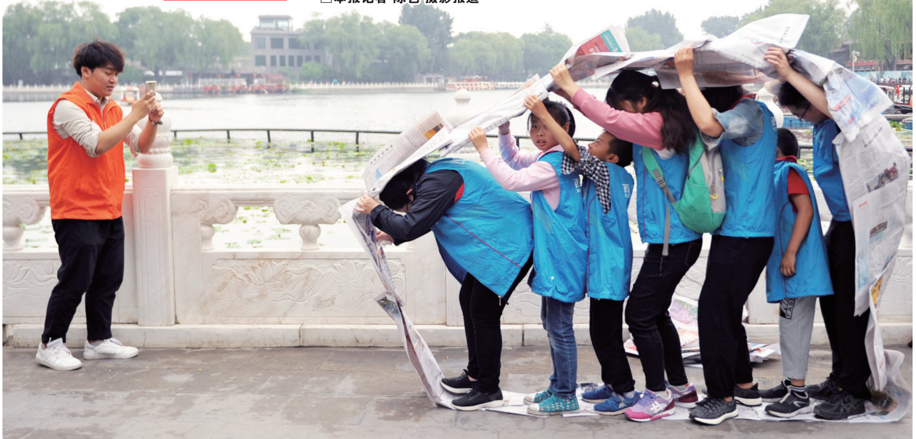
青年志愿者陪伴智障、自闭症、孤残儿童做游戏。

西城区什刹海街道有一个帮助困难群众的救助服务所，救助所的工作内容是什么？他们是怎样救助困难群众的……11月18日，劳动午报记者用镜头记录了他们救助困难群众的身影。