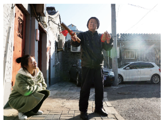
曾经被救助的老人，现在主动参与社区的文艺演了。