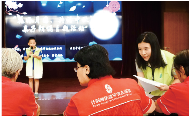
搭建才艺舞台，让救助孩子展示才能。