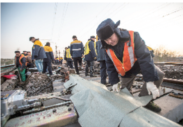
调试设备在户外需要覆盖保护。