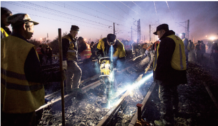
换轨需要工务段的职工共同配合完成。