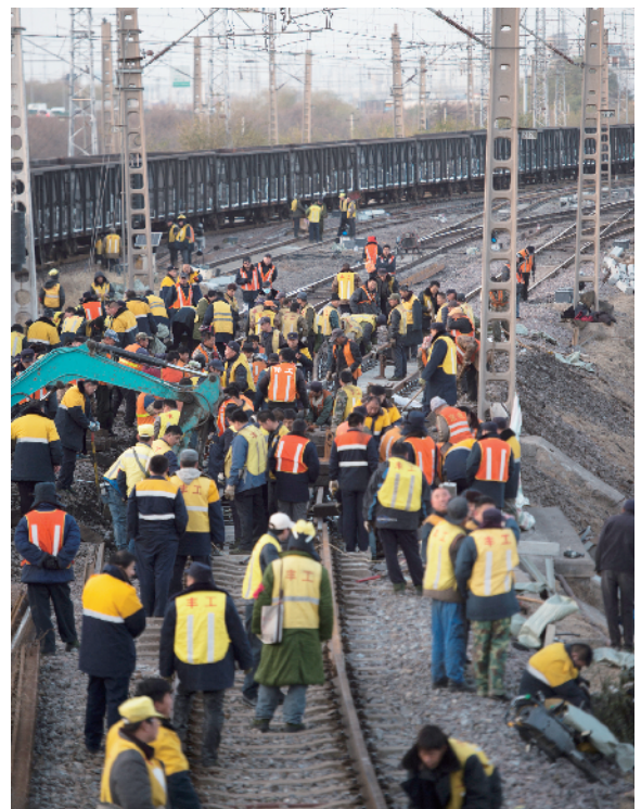
大家齐心协力，赶在规定时间内顺利通车。