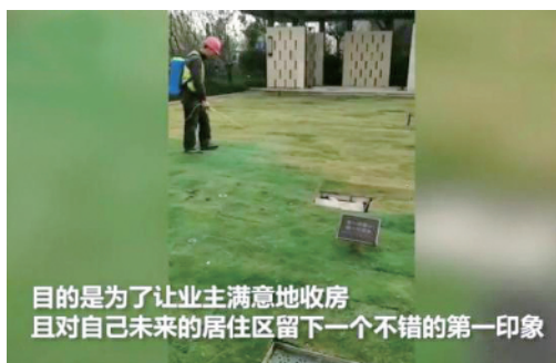
目的是为了业主满意地收房 且对自己未来的居住区留下一个不错的第一印象

看来，冲动之下的“剁手”并不是最好的购物状态。消费需要理智，不能仅仅凭借激情。“双十一”对自己，对商家都是机会，但是要量力而行，适度克制自己的欲望，只对对的，不买贵的，才是清醒的表现！