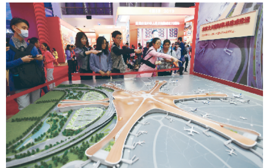
年轻观众最关注大兴国际机场建成投用。