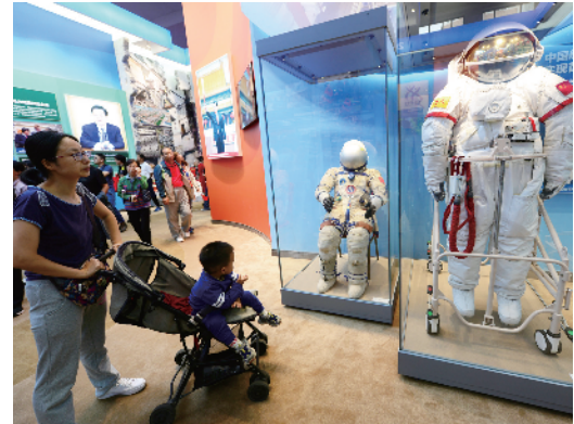
中国航天员是百姓心中的“明星”。