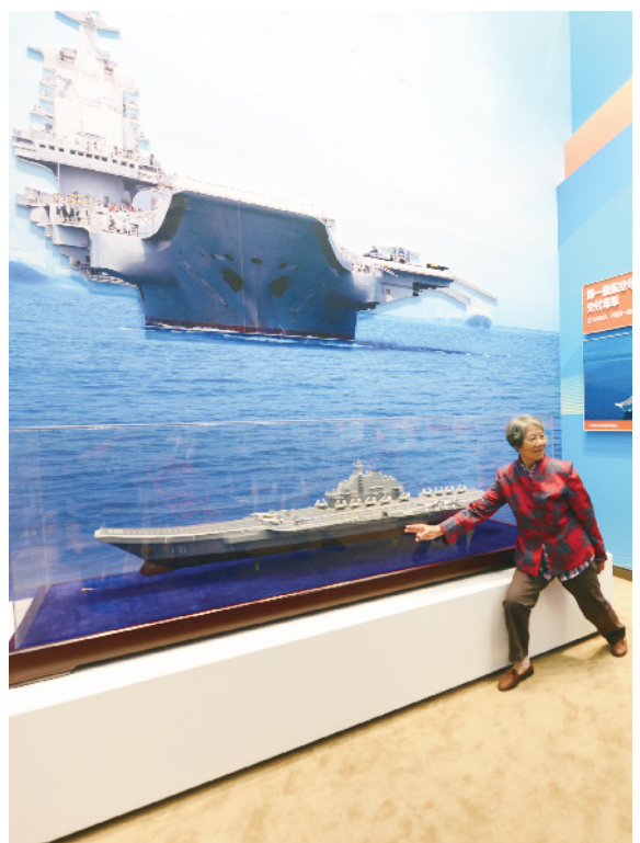
用舰载机起飞的手势与航母合影。