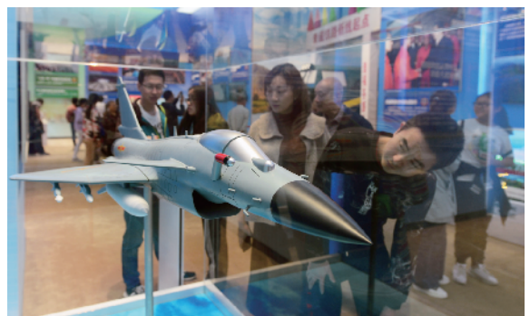
自主研发的预警机、歼击机,吸引了众多观众的眼球。