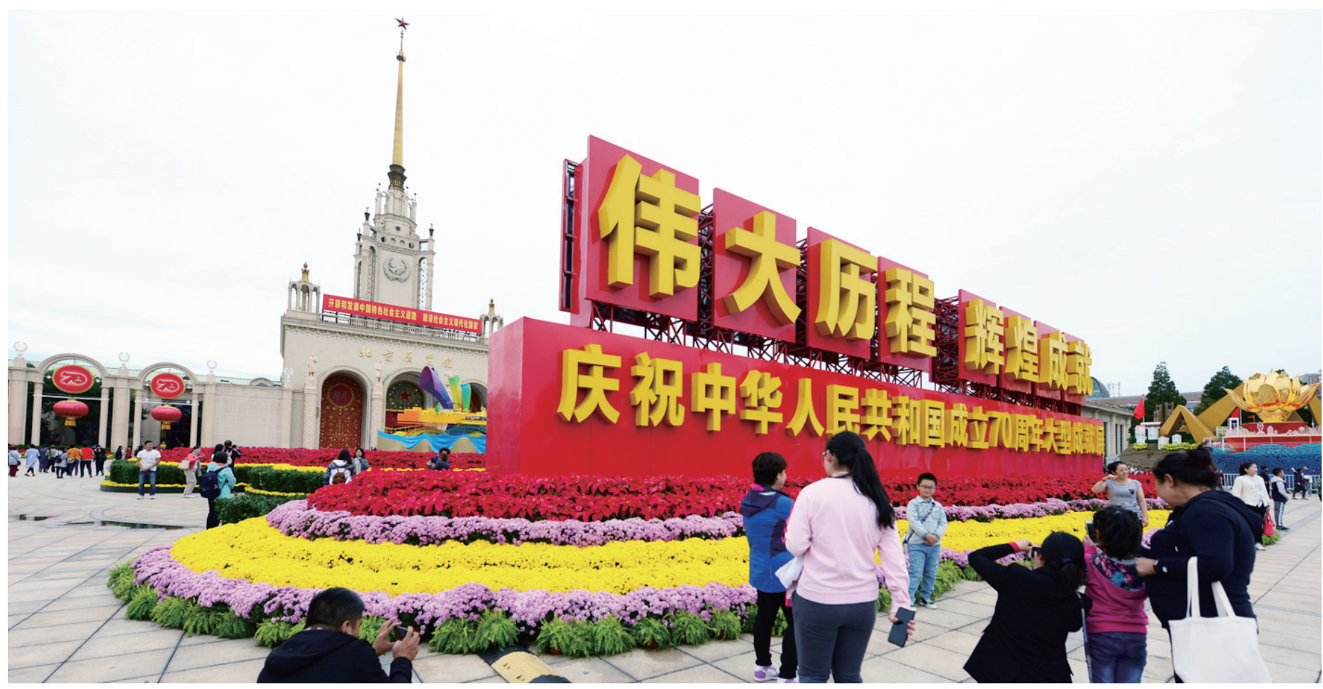
许多家庭、朋友圈自发组团,参观“伟大历程 辉煌成就”大型成就展。