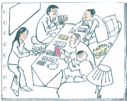
抓紧学用越来越多的遥控器。