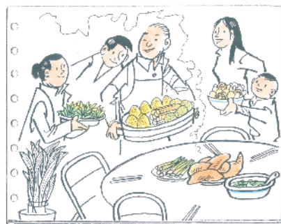
而今吃粗粮、野菜是改善生活！