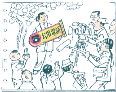
那时候整条街就是我家装了电话……