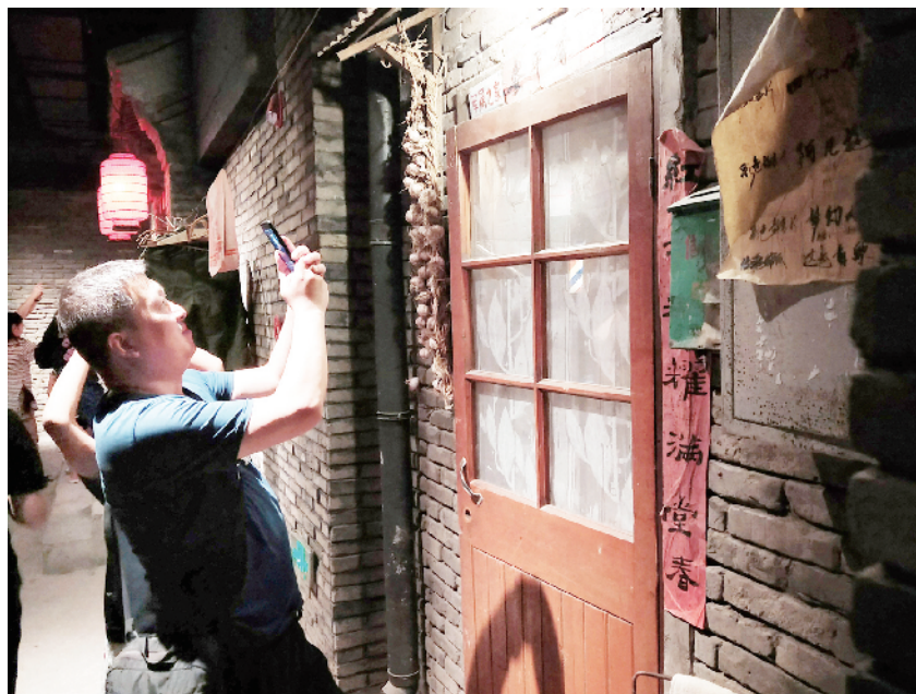
王先生一边举起手机拍照一边说“当年我们家门口就这样儿。”

故宫、长城、颐和园、北京烤鸭……提到北京,几乎所有人首先想到的都是这些。但在很多人记忆中,北京是狭窄的胡同,是奔跑嬉戏的孩童,是遛鸟下棋的老头儿,也是小时候最爱的卖桃酥、卖果子的粮油副食店,是闪闪发光的童年时光……胡同场景复原、经典老北京点心、童年回忆零食……“老北京”元素将历史文化与娱乐相结合,带给消费者一种全新的体验。“十一”假期,让来此旅游的人们更加直观地了解北京的风土人情。