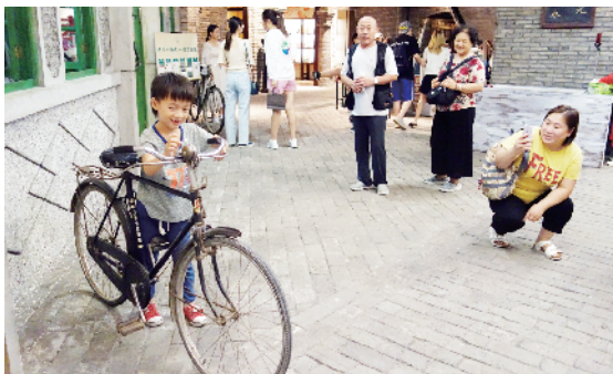
小朋友对前进副食店门前的二八自行车产生了兴趣。

胡同、粮油店、火车站、杂货铺……一个个鲜活真实的生活场景将人们带回到了上个世纪的北京城,还原出的老北京生活。这家落户在王府井百货大楼地下二层的“和平菓局”作为国内首家场景沉浸式体验空间,开业以来每日前来参观的游客络绎不绝,成了京城网红打卡地。