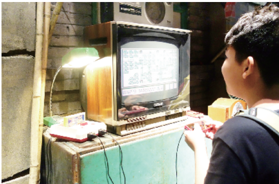
小霸王游戏机曾是“80后”们最快乐的游戏配置。