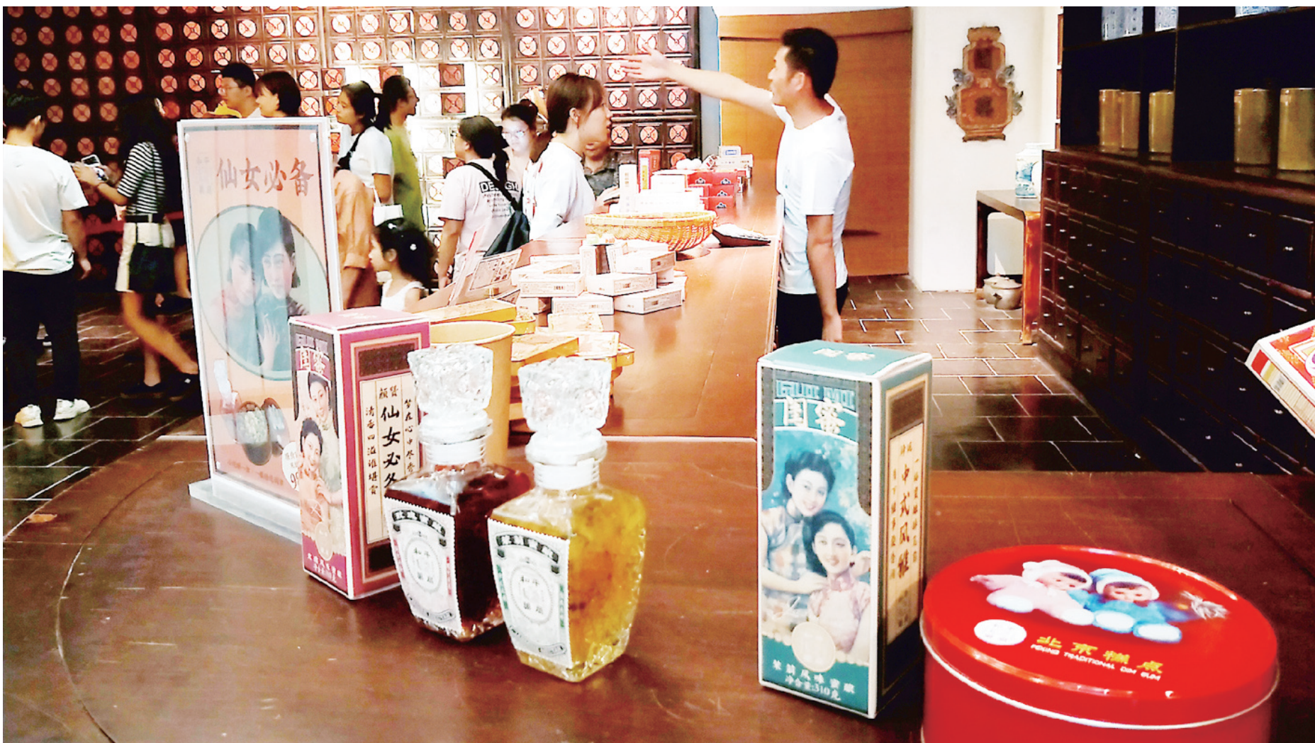
上个世纪,人们常用的国货护肤品赢得了爱美姑娘的芳心。