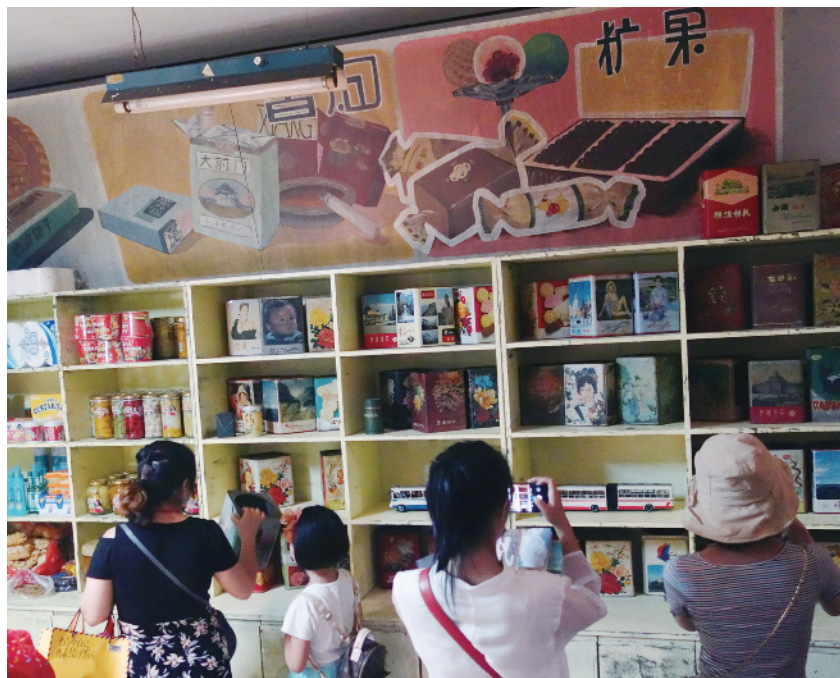
副食店里的很多零食都是曾经大家味蕾的最爱。