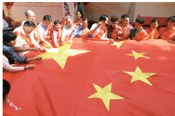
北京榜样代表绣国旗。