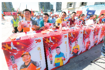
不同快递公司的代表。