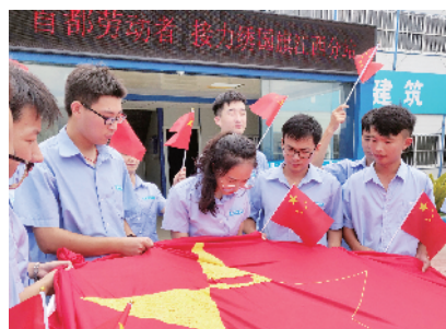
中建一局在江西南昌绣国旗活动。