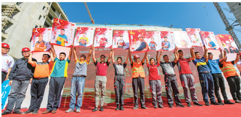
快递小哥与农民工秀出自己的海报。