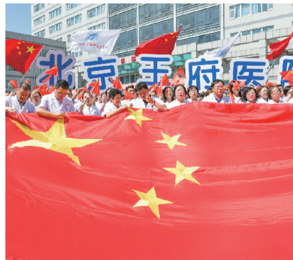
北京王府医院的职工们在绣国旗。