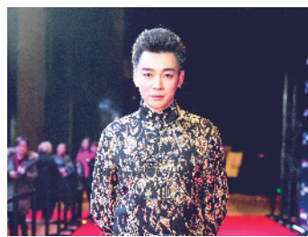
谭正岩 谭门第七代传人重铸京剧文化