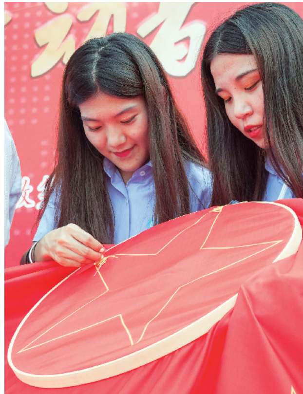
年轻的女职工正在认真的绣红旗。