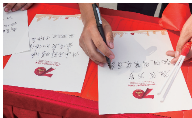
劳动者书写祝福语。

据介绍,此次首都万名职工绣国旗活动是一次齐心协力的大团结、大凝聚行动,也是一项过程复杂、难度系数高的大工程,更是一场检验组织力和战斗力的大考验。活动除在本市各区开展外,还将涉及首都职工工作所在的20余个省、市、自治区的30个站点,活动将于“十一”前结束。