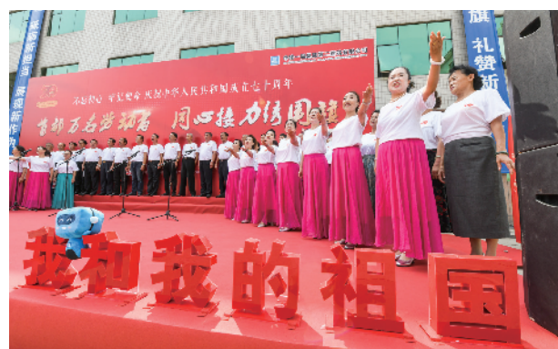
70名退休职工唱响“我和我的祖国”。