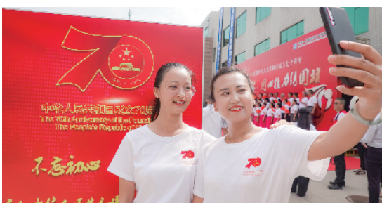
活动现场成为一道风景线。

8月8日,由北京市总工会主办,劳动午报社和中建一局二公司承办的“把微笑带回家 为最美劳动者点赞”大型公益活动之“首都万名劳动者 同心接力绣国旗”活动在京举行启动仪式。首都万名劳动者同心接力一针一线绣国旗,为祖国母亲献上一份特殊的国庆礼物。