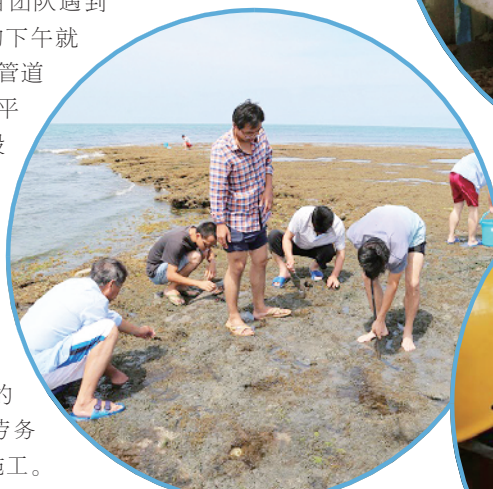
工人们下班后在赤道几内亚的沙滩上捡鱼

买发电机的事情。项目一共有4台发电机,两台施工用,两台生活用,其中生活用的一台发电机采购自当地的一家外企。由于质量问题,发电机需要维修,但恰好这家外企的工程师回国休整,需要等一个月。等工程师回来,检查完发电机后说,得先交全款,以便去欧洲购买材料。又等一个月,材料到了。再花一个星期,才修好。