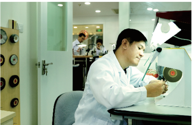
复原表壳的不锈钢拉丝,要求与新表一样。