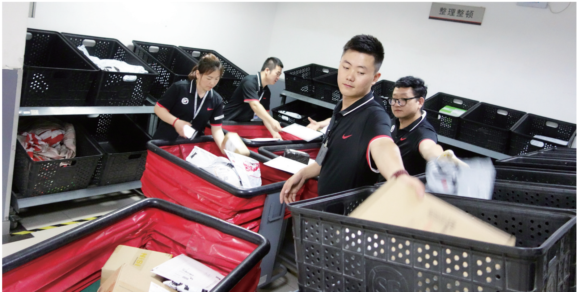
小件快递分拣耗时耗力，需要工作人员更为细心仔细。