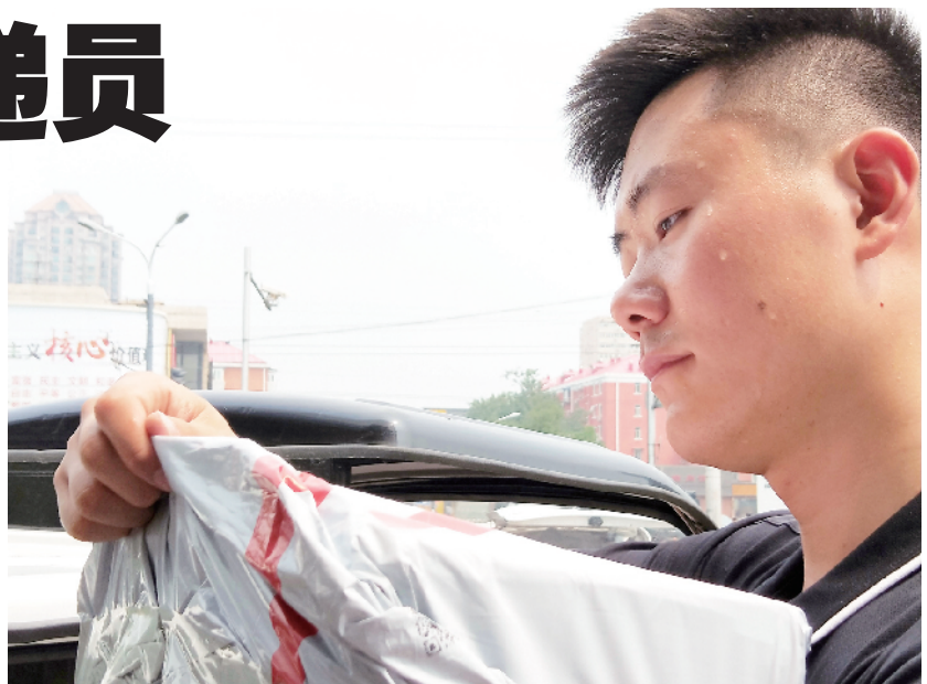
烈日下，刚工作一会儿汗水就浸湿了衣服。