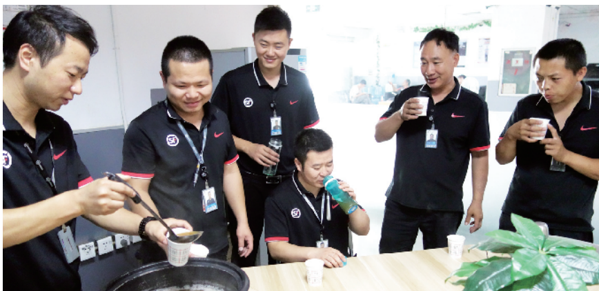
快递站点的职工之家每天都给大家准备防暑饮品。