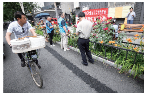
遛早回来的居民也被吸引停车听会。