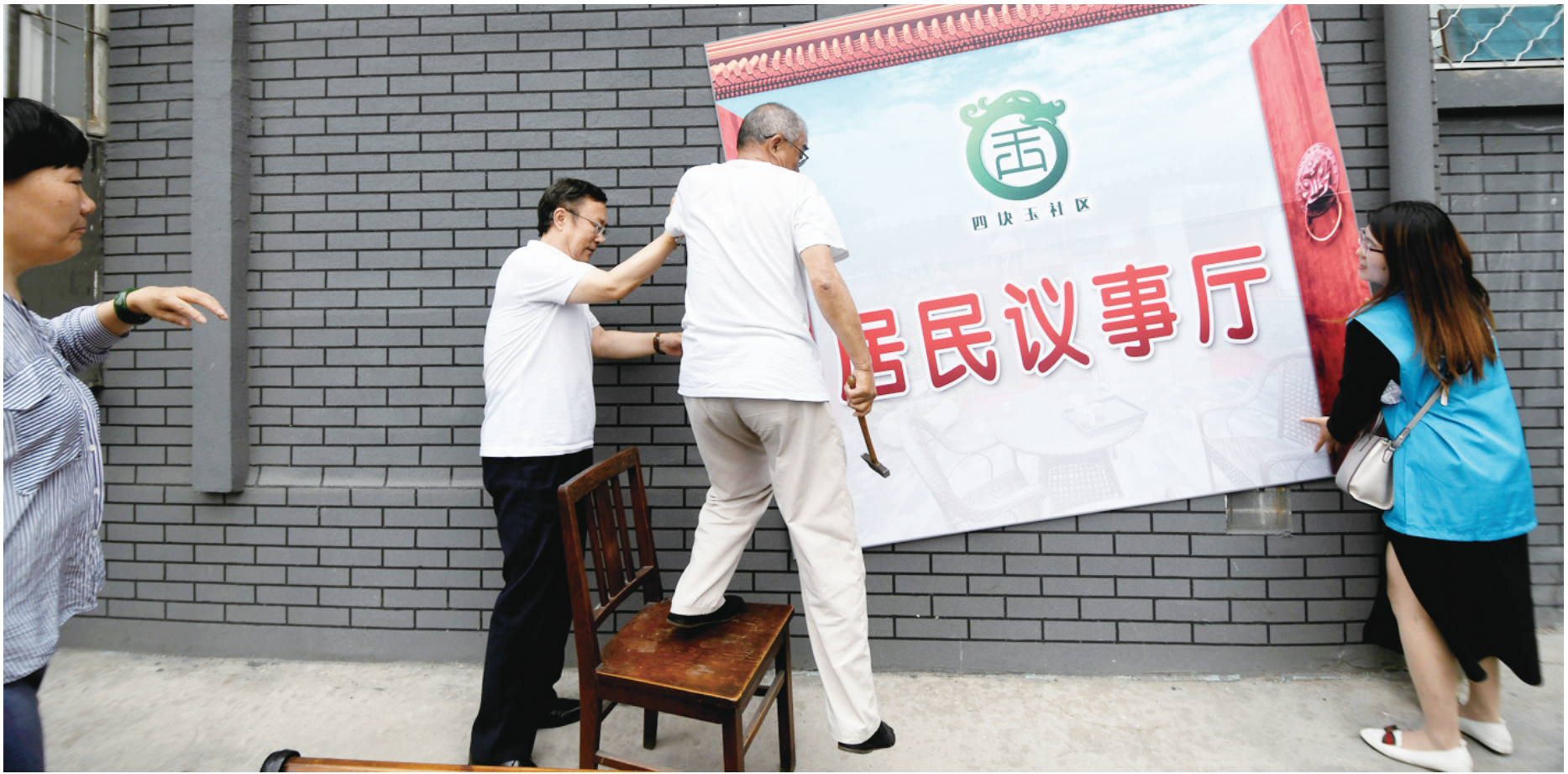
布置会场时，总有热心居民来主动帮忙。