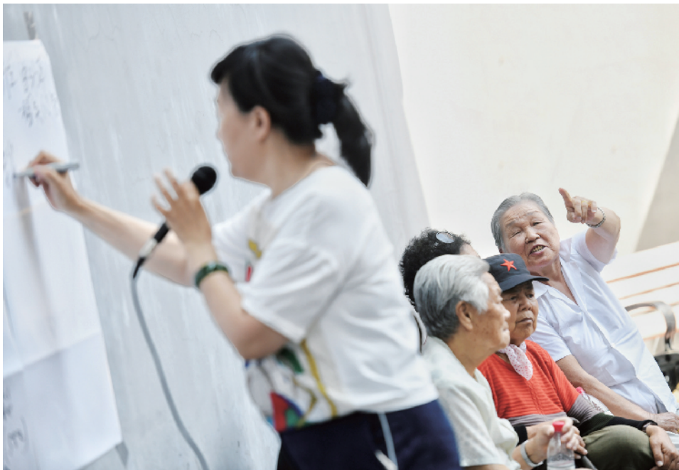
居民们的诉求被工作人员一一记录下来。