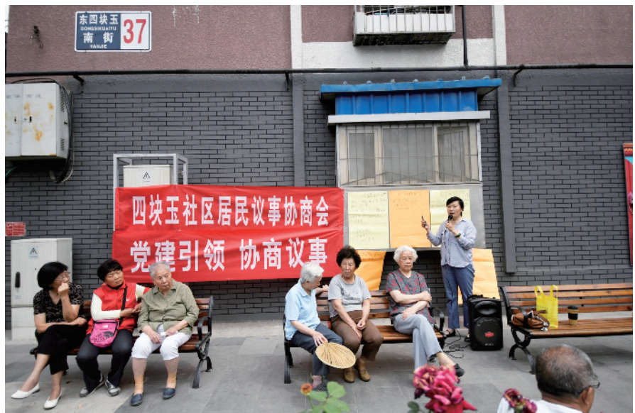
小区内新建的口袋公园变成了临时“露天会议室”。

这已经不是四块玉社区第一次召开居民议事会了，由于产权不同，年代久远，没有物业，辖区的居民楼很难实现统一的物业管理。社区根据不同产权、不同院落、不同楼房的具体情况，分别多次召开居民议事会，让居民将目前面临的问题和诉求说明、说透，再建立自治公约，将问题分为社区出面解决和居民自我管理两大类，最终实现全面的社区治理，大家的事儿大家办。