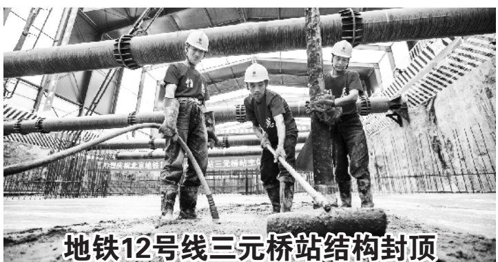
地铁12号线三元桥站结构封顶

针对老年人权益受损和上当受骗的问题,卢彦提出,下一步,要对本市涉老金融诈骗案件及情况进行摸底调查分析,研究制定防骗策略,在全市开展防范金融诈骗主题宣传教育活动。对行动不便的老年人实行电话预约、上门服务,为老年人免费提供法律咨询、公证、司法鉴定等服务。